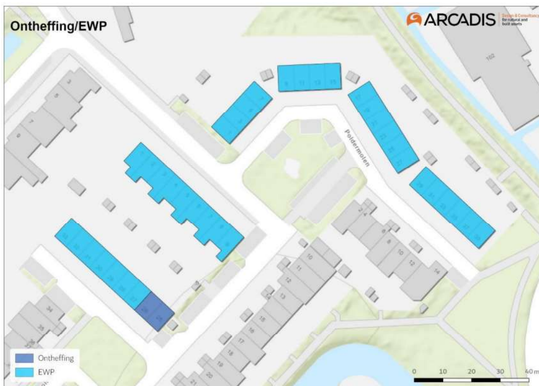
Figuur 1. Ligging en omvang projectgebied met de woningen waar werkzaamheden plaatsvinden. Deze woningen liggen in Mijdrecht.