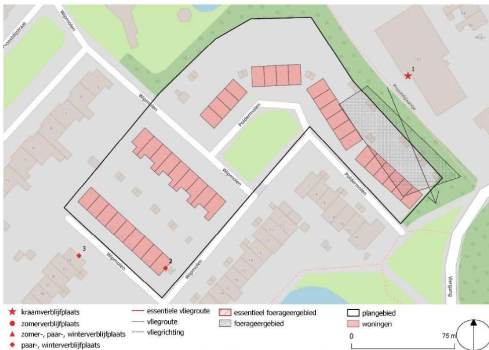
Figuur 4. Locaties van de vastgestelde verblijfplaatsen van gewone dwergvleermuis en foerageergebied en vliegroute van gewone dwergvleermuis en laatvlieger in en nabij het projectgebied (Eco-niche, 2022).