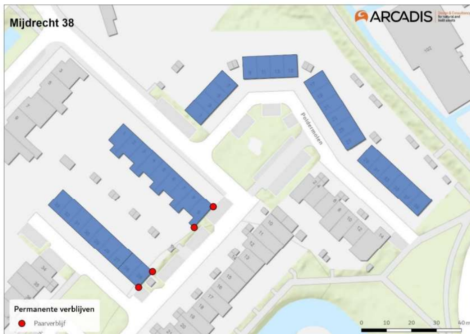
Figuur 5. Locatie van de permanente paarverblijven op de kopgevel van Wipmolen 25 en de kopgevel van Wipmolen 9.