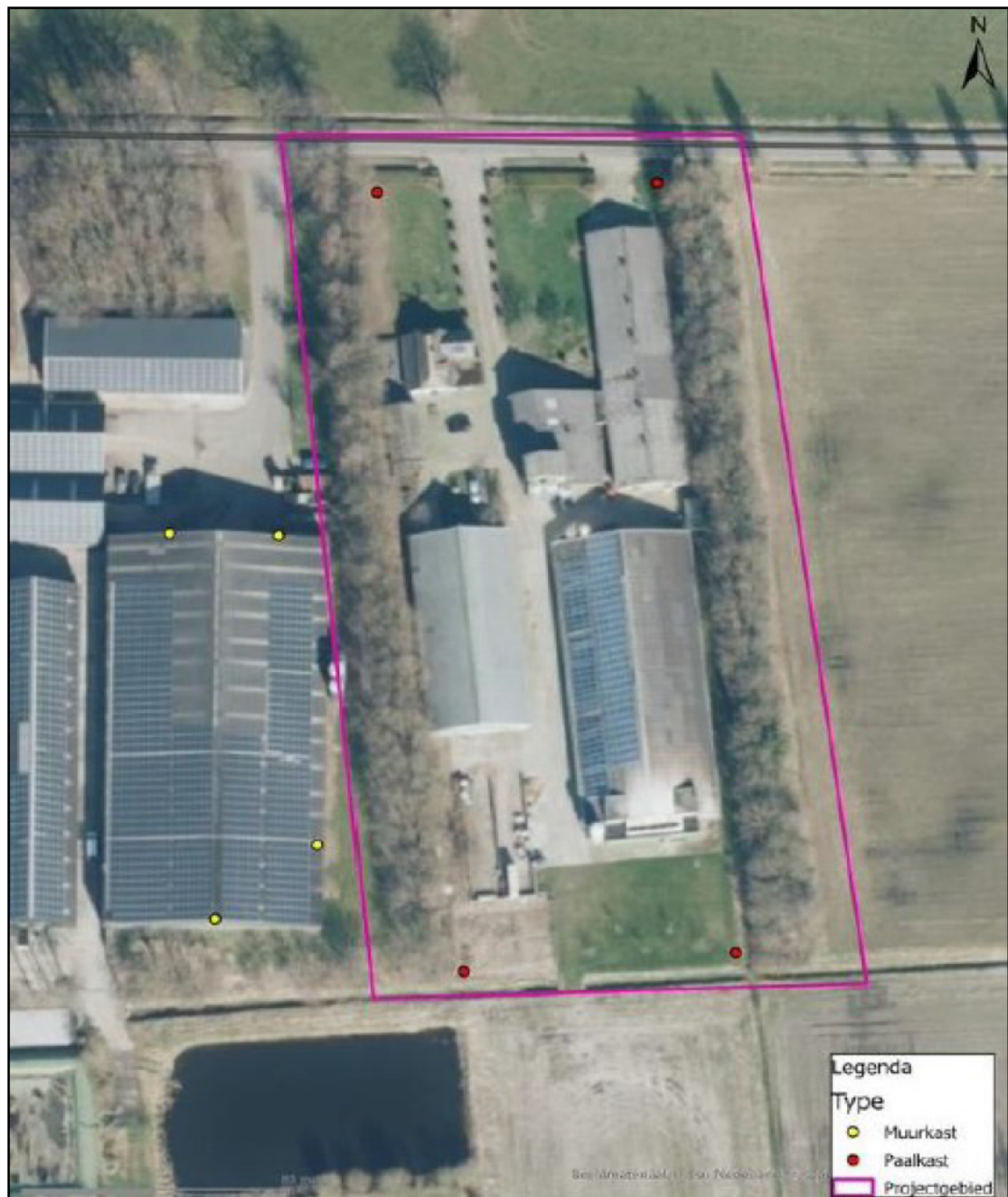
Figuur 2. De locaties van de tijdelijke voorzieningen voor gewone dwergvleermuis en gewone grootoorvleermuis. De rode stippen weergeven vier paalkasten van het type VMPT1 van Unitura en de gele stippen weergeven vier kasten van het type VK WS o8 van Vivara Pro. Het plangebied is roze omljnd weergegeven.