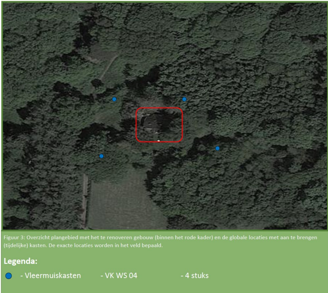
Figuur 2. Locaties van de tijdelijke vleermuiskasten ten opzichte van de te renoveren woning.