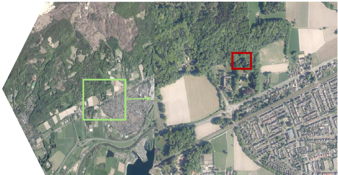
Figuur 1. Ligging en aanduiding van de te renoveren woning aan de Arnhemsestraatweg 58 te Rheden.