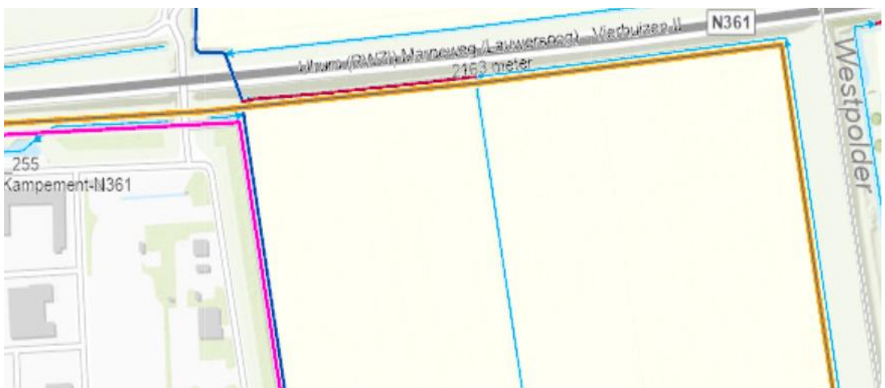
Figuur 2: globale ligging persleidingen (bruine en roze lijn) waterschap (locatie oostzijde kazerne).