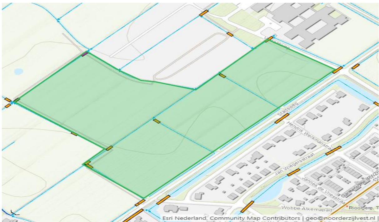
Figuur 1: Plangebied.

De aanvraag omvat de volgende werkzaamheden/activiteiten; het verbreden en herprofilen van watergangen, het aanleggen van dammen met duikers, het afsluiten van duikers, het verplaatsen van een vaste dam en het aanleggen van uitstroomvoorzieningen van hemelwater, nabij de percelen kadastraal bekend als Ten Boer, Sectie A, perceelnummers 1619 en 4930.