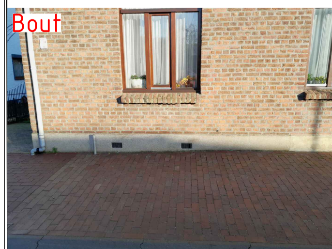
Hegge 78 Bestaande bout