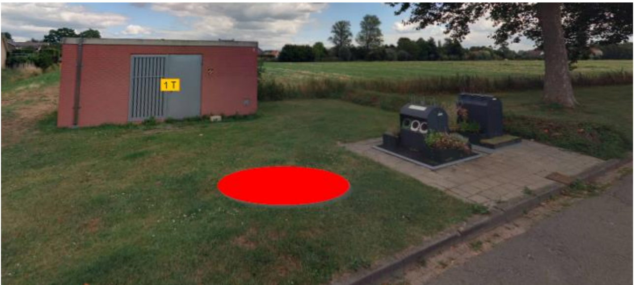
Figuur 2: Omgeving containerlocatie