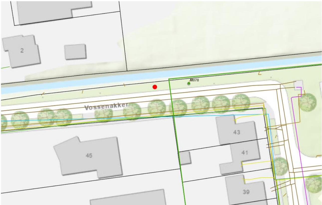
Figuur 1: Kaartbeeld containerlocatie

Figuur 1 (kaartbeeld containerlocatie) geeft de ligging van de containerlocatie weer op kaart met een rode stip. Figuur 2 (omgeving containerlocatie) geeft een sfeerimpressie van de directe omgeving en de precieze locatie (aangegeven met een rode stip).