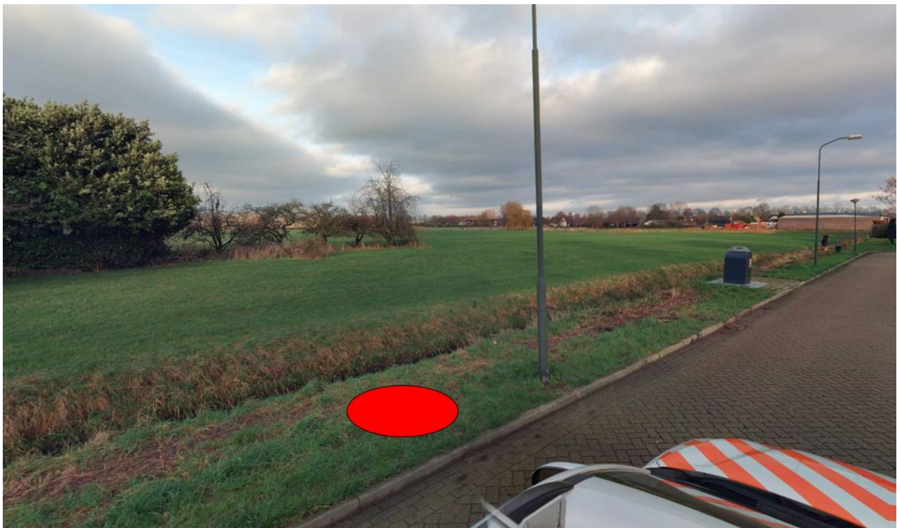
Figuur 2: Omgeving containerlocatie