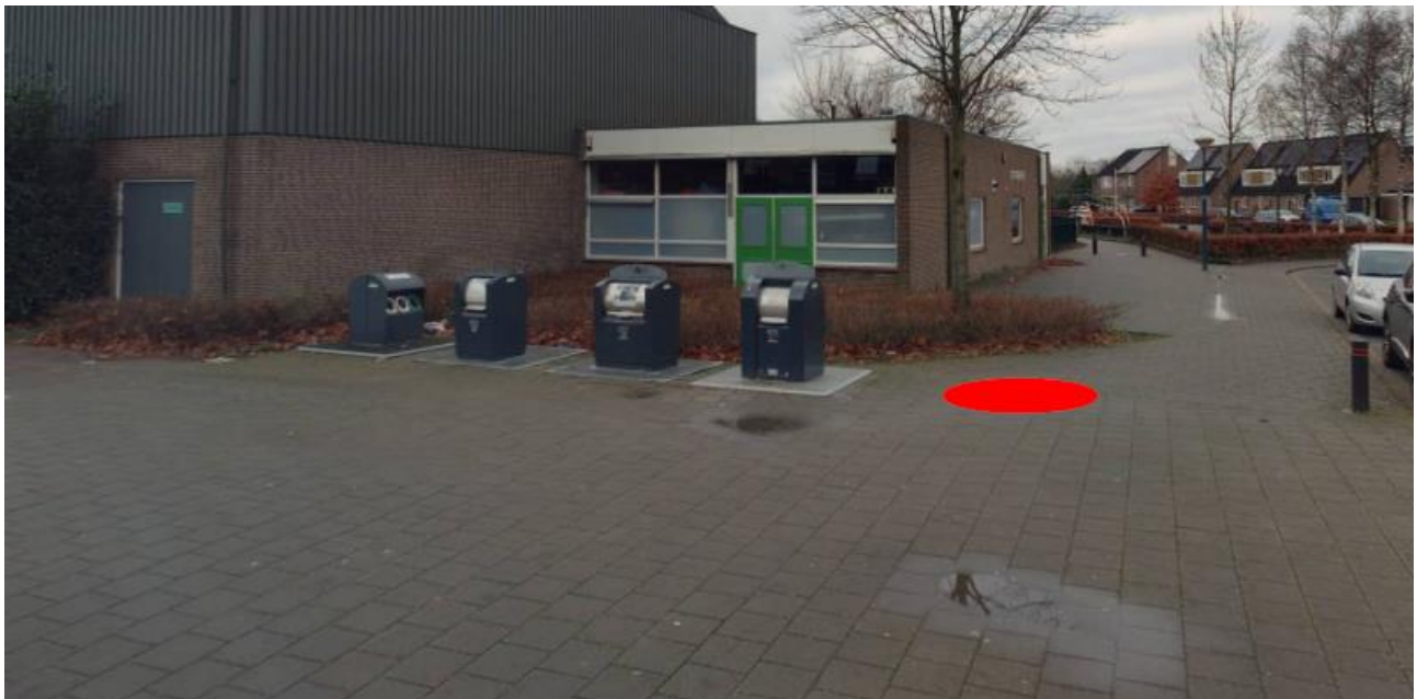
Figuur 2: Omgeving containerlocatie