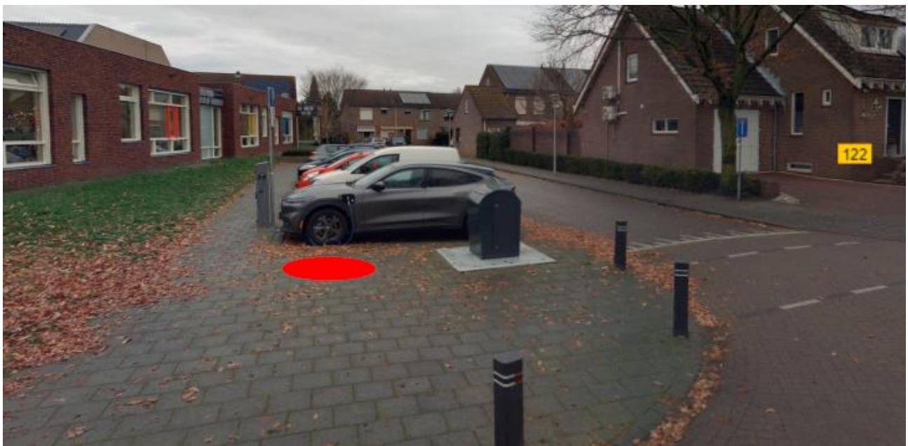
Figuur 2: Omgeving containerlocatie