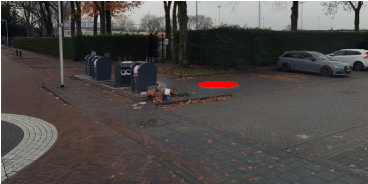
Figuur 2: Omgeving containerlocatie