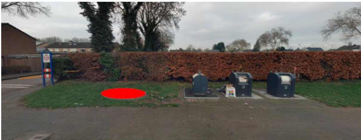
Figuur 2: Omgeving containerlocatie