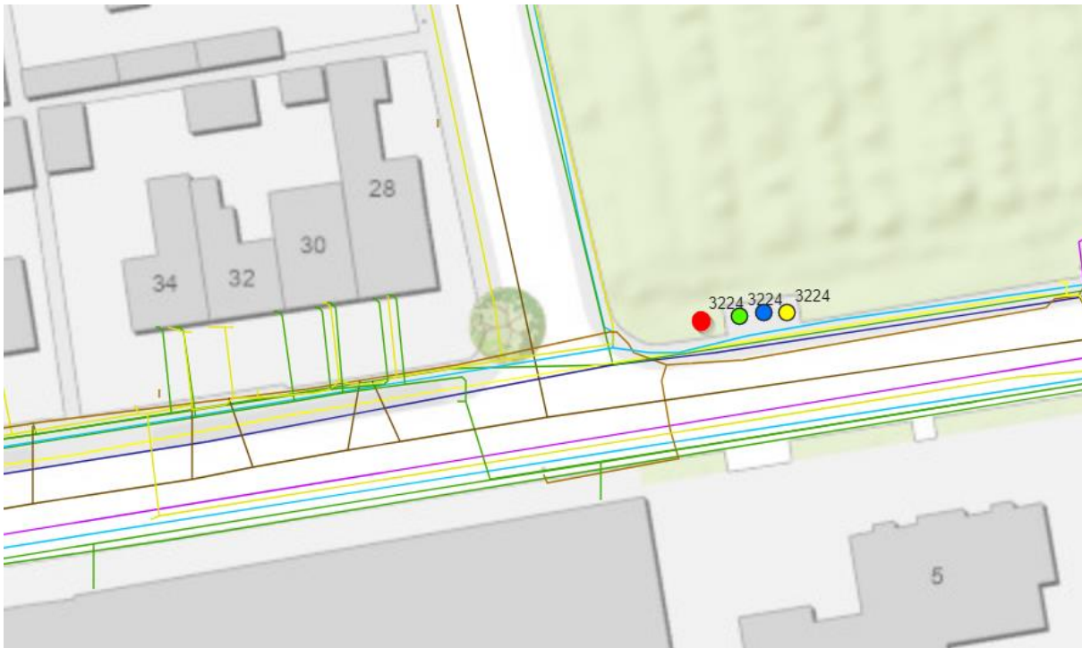
Figuur 1: Kaartbeeld containerlocatie

Figuur 1 (kaartbeeld containerlocatie) geeft de ligging van de containerlocatie weer op kaart met een rode stip. Figuur 2 (omgeving containerlocatie) geeft een sfeerimpressie van de directe omgeving en de precieze locatie (aangegeven met een rode stip).