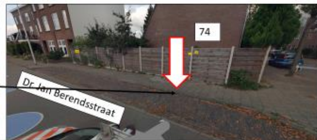
Dr. Jan Berendsstraat; noordzijde, ter hoogte van zijkant pand Jan van Speykstraat 74