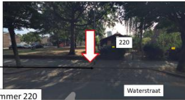
Waterstraat; oostzijde, ter hoogte van huisnummer 220