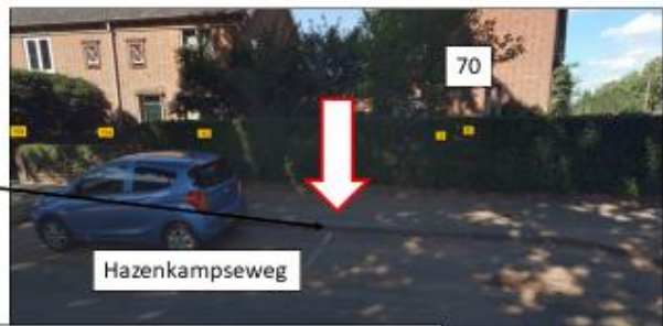
Hazenkampseweg; noordzijde, ten zuiden van pand Nimrodstraat 70