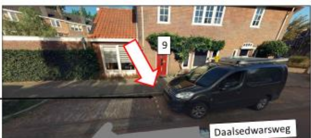
Daalsedwarsweg; westzijde, ter hoogte van huisnummer 9