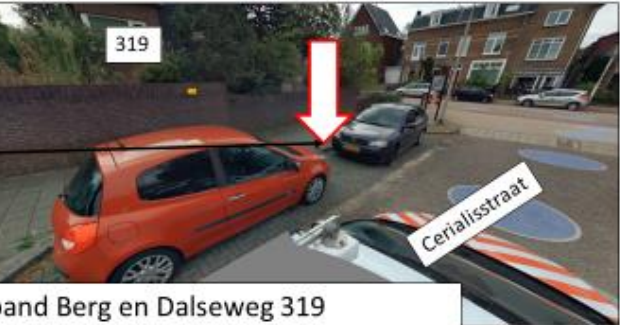
Cerialisstraat; oostzijde, ten westen van pand Berg en Dalseweg 319