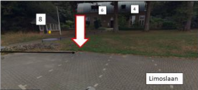
Limoslaan; zuidwestzijde van pand met huisnummer 8