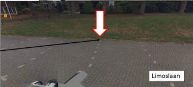
Limoslaan; zuidwestzijde pand met huisnummer 8 (naast bovengenoemde plekken)