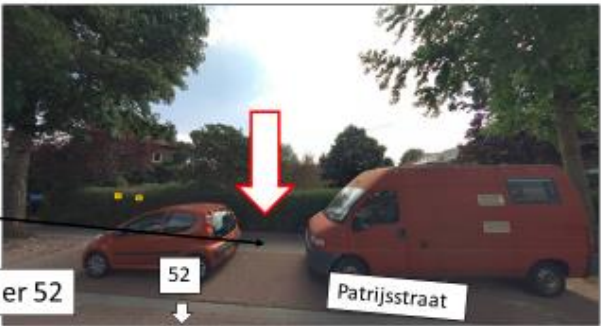
Patrijsstraat; zuidzijde, tegenover huisnummer 52