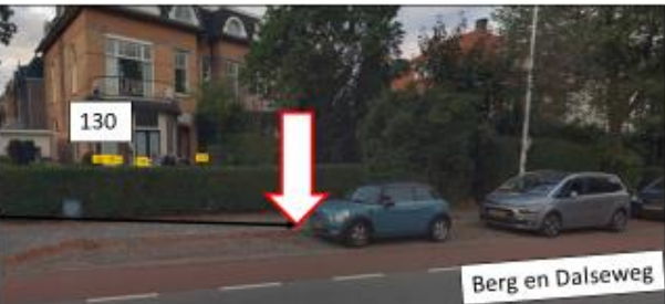
Berg en Dalseweg; zuidzijde, ten noorden van huisnummer 130