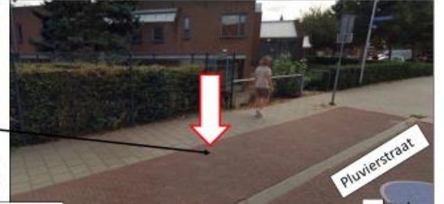
Pluvierstraat; oostzijde, tegenover huisnummer 9