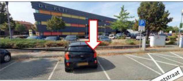
Pijlpuntstraat; parkeerplaats westzijde huisnummer 20 (naast bestaande oplaadplek)