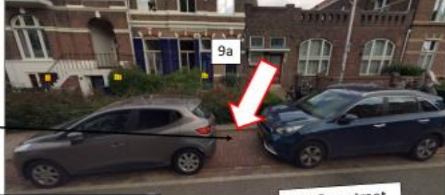
Stijn Buysstraat; noordzijde, ter hoogte van huisnummer 9a