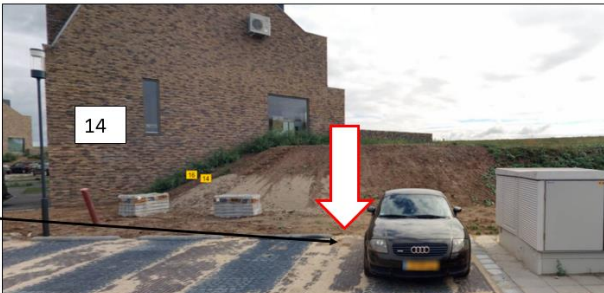
Porrenhofstraat; westzijde van huisnummer 14