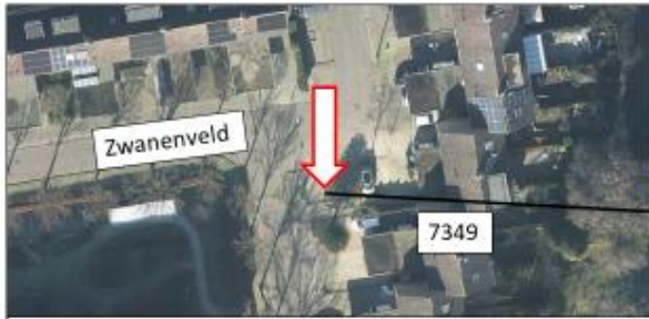
Zwavenveld; noordwestzijde van huisnummer 7349