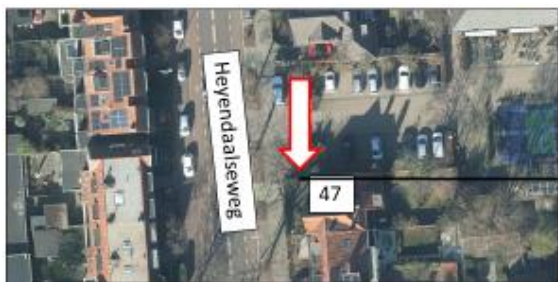
Heyendaalseweg; noordzijde huisnummer 47