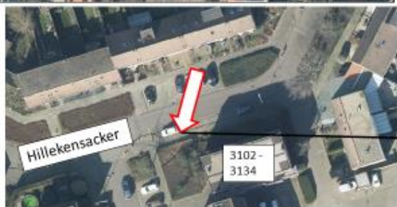
Hillekensacker; noordzijde pand met huisnummers 3102 - 3134