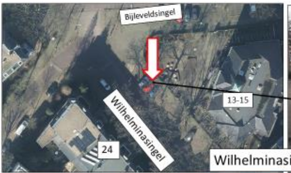
Wilhelminasingel; noordzijde, tegenover huisnummer 24