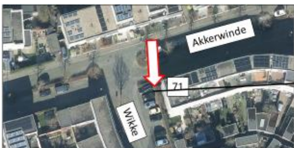
Wikke; oostzijde, aan zijkant pand Akkerwinde 71