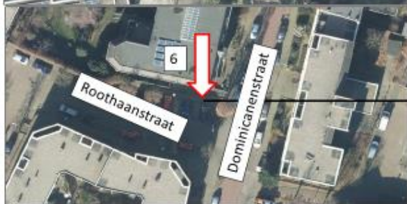
Roothaanstraat; noordzijde, ten zuiden van pand Dominicanenstraat 6