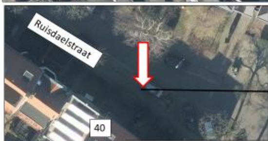
Ruisdaelstraat; zuidzijde, ter hoogte van huisnummer 40