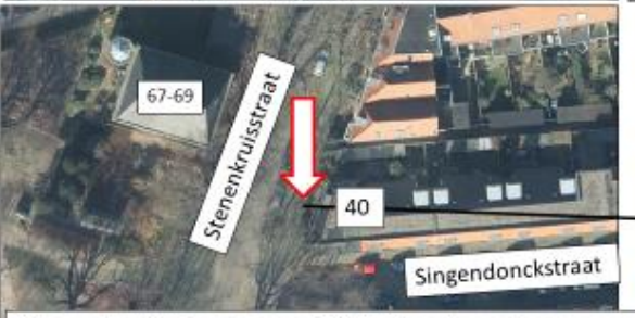
Stenenkruisstraat; oostzijde, ter hoogte van pand Singendonckstraat 40