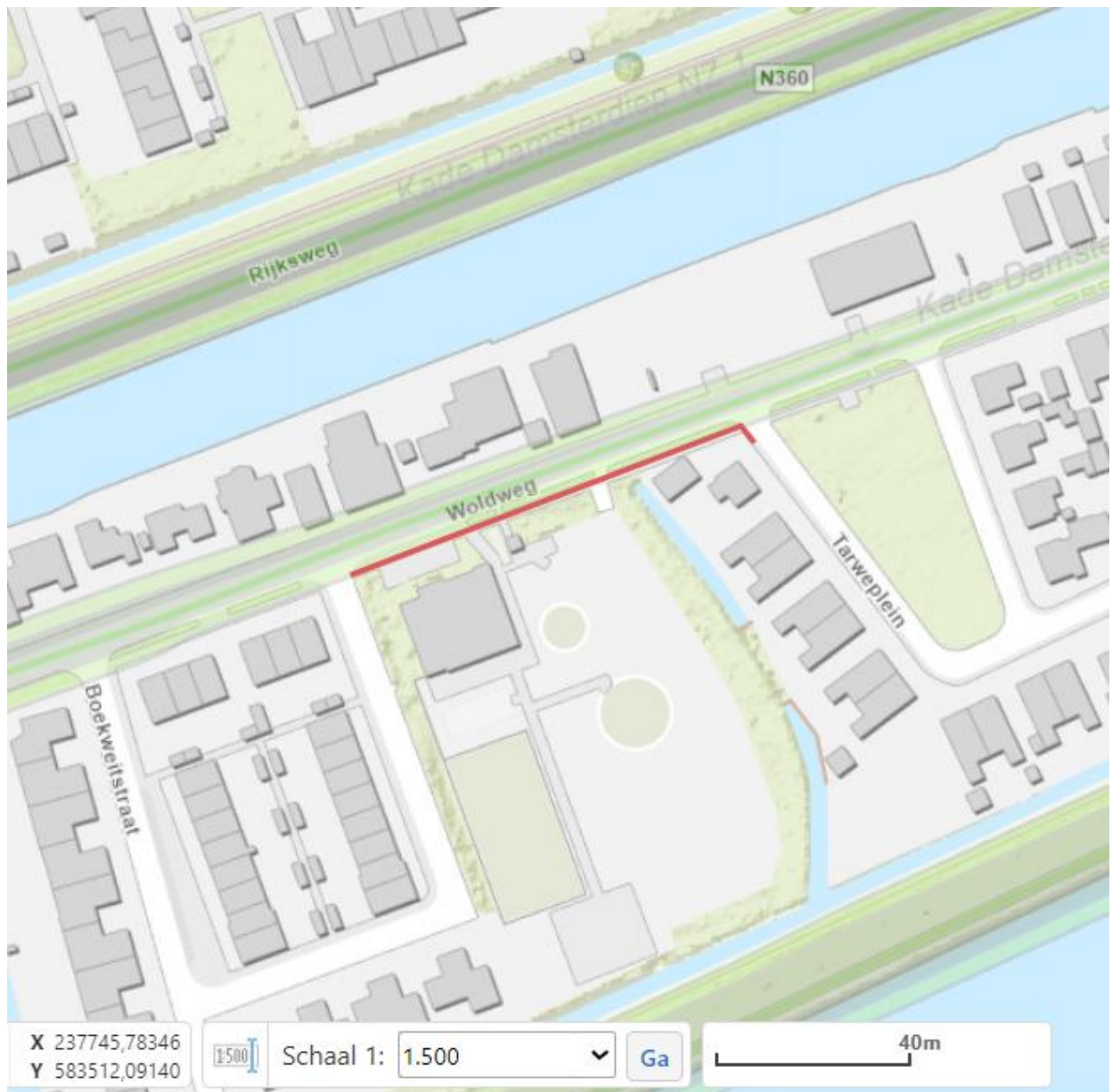
Figuur 1: Overzichtstekening van de werkzaamheden. De rode lijn geeft globaal de locatie weer van de aan te leggen waterleiding.

Het dagelijks bestuur van het waterschap Noorderzijlvest heeft op 15 augustus 2023 van namens Groningen een aanvraag ontvangen om een vergunning als bedoeld in hoofdstuk 6 van de Waterwet (Wtw). De aanvraag betreft het aanleggen van waterleidingen nabij Woldweg 14 en 41 te Groningen, zoals hieronder globaal is weergegeven in figuur 1 en 2.