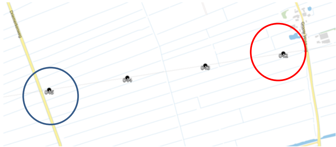
Figuur 2. Voorkeurslocatie op mast 45 (blauwe cirkel) waar een aanzet voor een alternatieve nestlocatie voor de ooievaar wordt gemaakt, ten opzichte van het huidige ooievaarsnest in mast 42 (rode cirkel). Als om enige reden mast 45 niet geschikt is, kan ook gekozen worden voor mast 44.