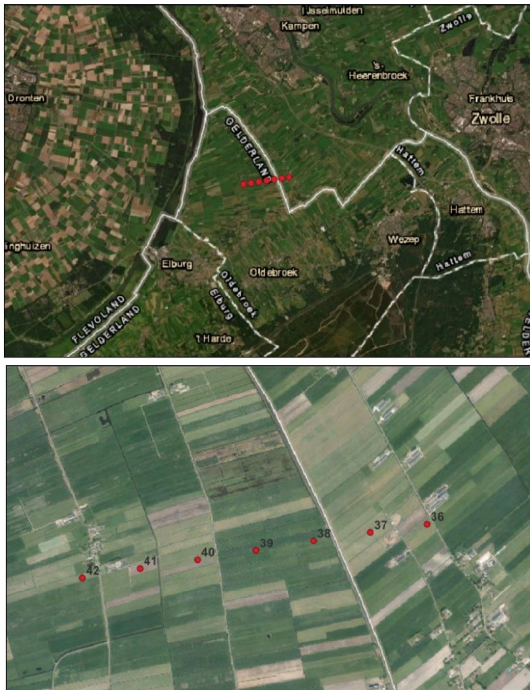
Figuur 1. (Globale) ligging van hoogspanningsmast 42 (meest westelijke) waarop dit besluit betrekking heeft.