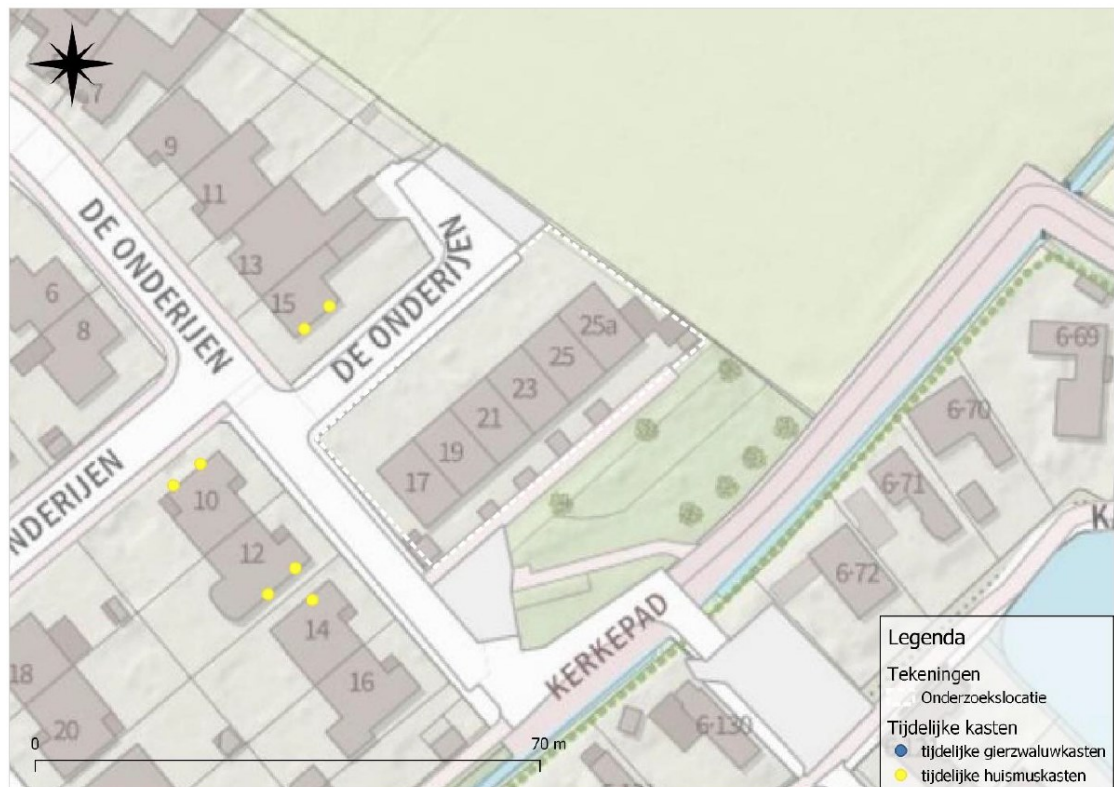
Figuur 2. Indicatieve locaties voor tijdelijke voorzieningen voor huismus ten opzichte van de projectlocatie.