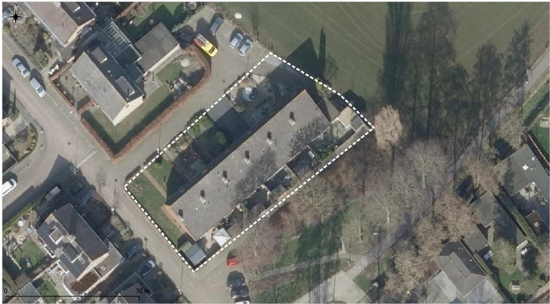
Figuur 1. Ligging en begrenzing projectgebied aan De Onderijen 17 t/m 25a (oneven nummers) te Oosterhout (witte stippellijn).