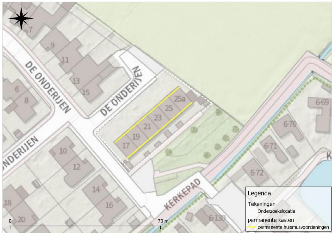
Figuur 3. Permanente voorzieningen in de toekomstige situatie door het verhoogd plaatsen van vogelschroot over de totale daklengte.