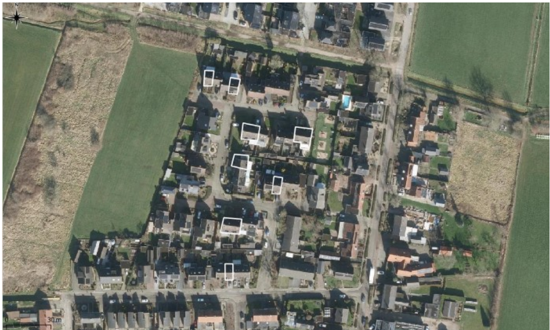
Figuur 2: De projectlocaties (wit omkaderd).