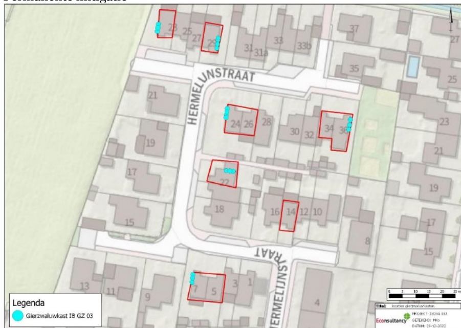
Figuur 5: Locaties van de permanente inbouwkasten voor de gierwaluw (blauwe stippen)