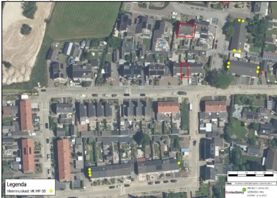
Figuur 6: Locaties voor de tijdelijke vleermuiskasten voor de gewone dwergvleermuis (gele stippen)