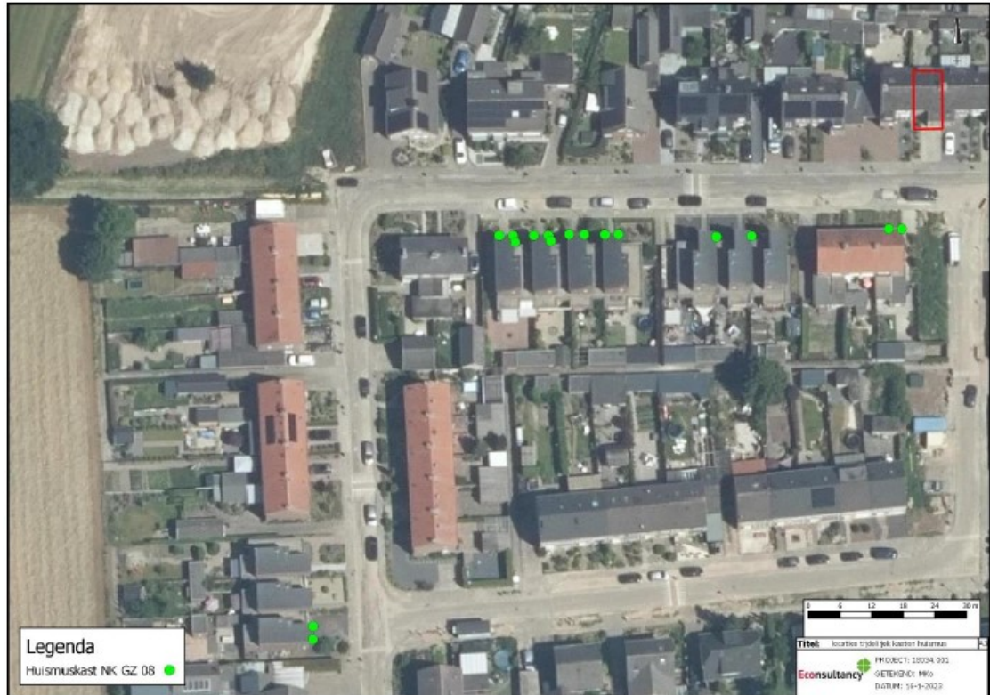
Figuur 3: Locaties voor de tijdelijke nestkasten voor de huismus (groene stippen).