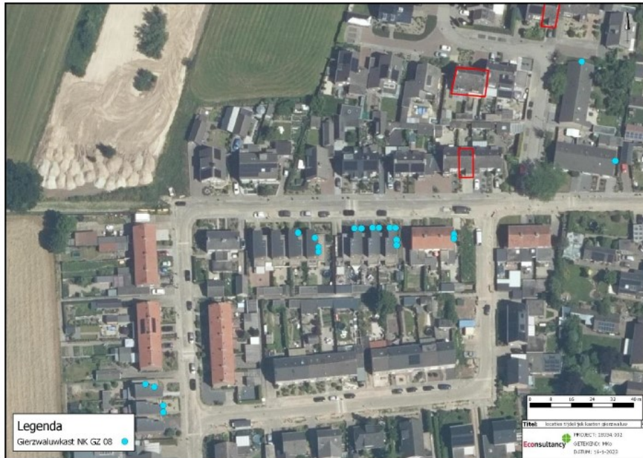
Figuur 4: Locaties van tijdelijke nestkasten voor de gierwaluw (blauwe stippen).