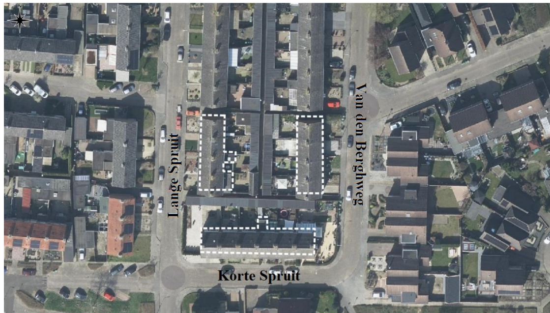
Figuur 1: Indruk van het projectgebied (witte stippellijn): Korte Spruit 29 tot en met 39, Lange Spruit 14 tot en met 20 en Van den Berghweg 30 tot en met 36 te Didam.