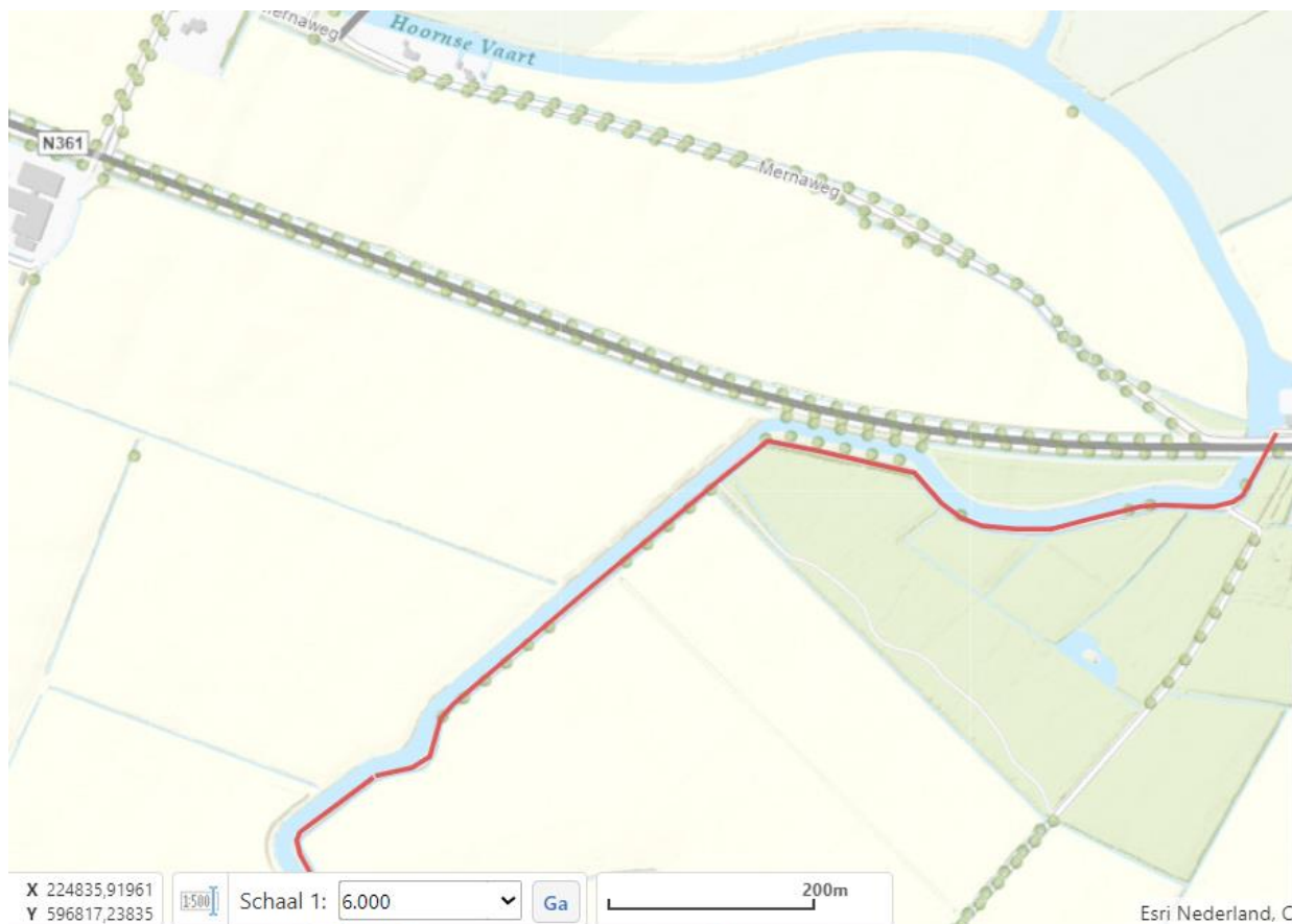
Figuur 2: Schematische tekening van de werkzaamheden. De rode lijn geeft globaal de locatie weer van het aan te leggen tracé.

De vergunningaanvraag is bij waterschap Noorderzijlvest geregistreerd onder het zaaknummer Z/23/063933 en omvat de volgende voor dit besluit relevante stukken: