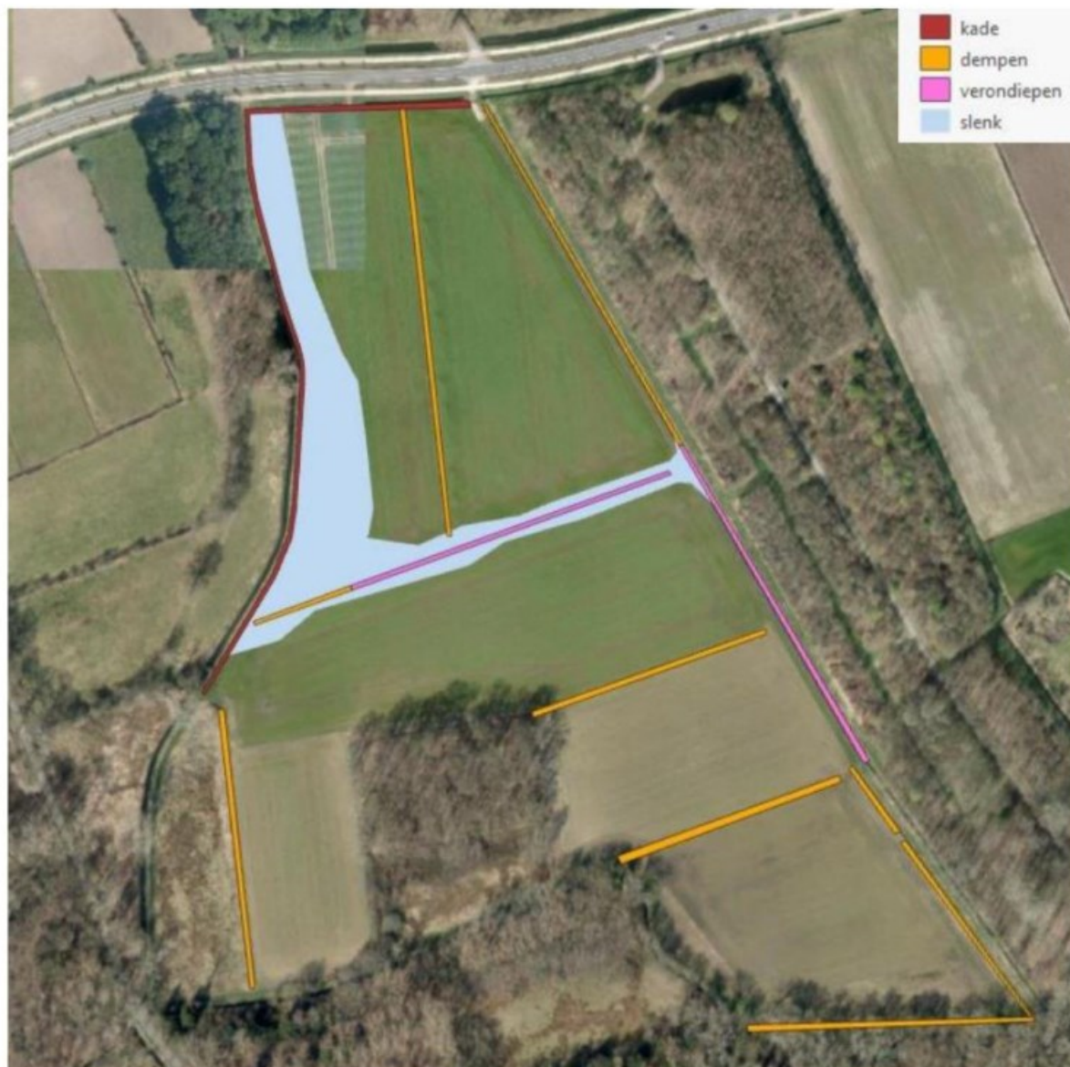
Figuur 10 Te dempen of te verondiepen watergangen, slenk en kade