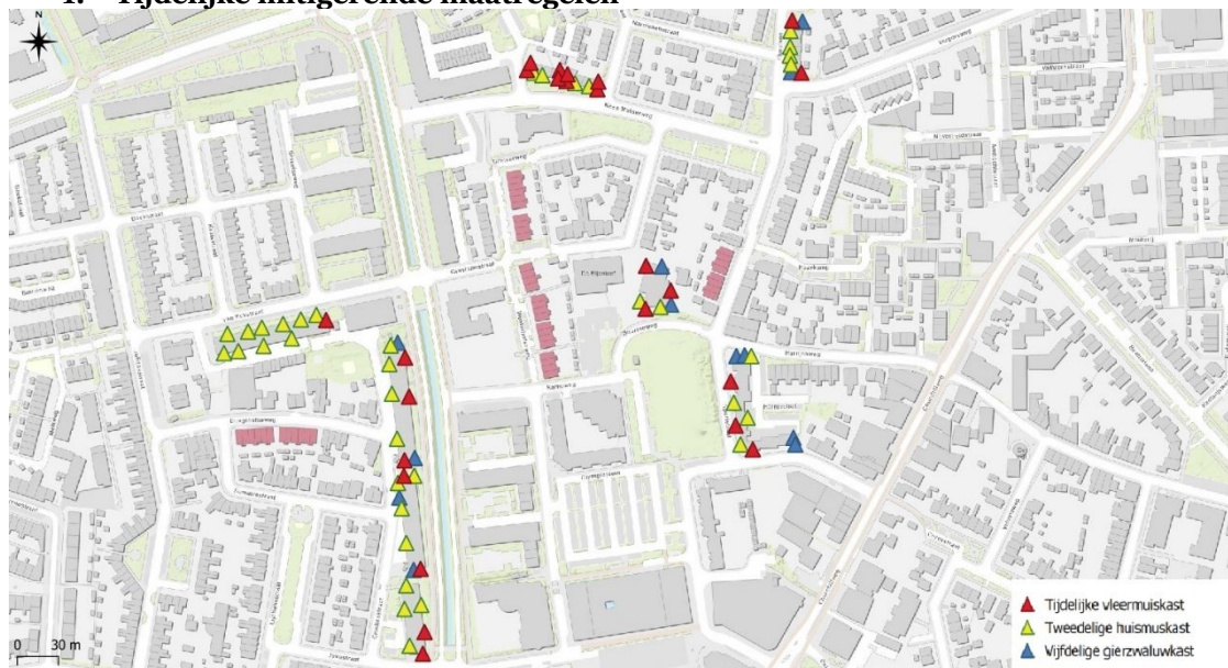
Figuur 2: Overzicht van de locaties waar de tijdelijke mitigerende maatregelen voor gewone dwergvleermuis (rood), gierzwaluw (blauw) en huismuis (geel) worden gerealiseerd.