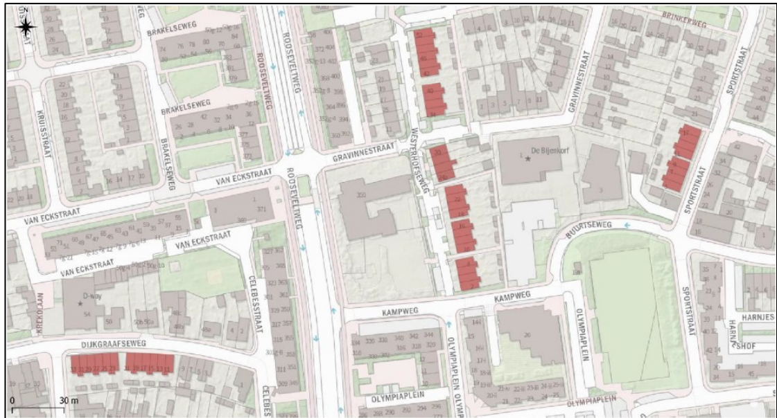
Figuur 1: Indruk van het plangebied, met in het rood de woningen waar de renovatiewerkzaamheden zullen plaatsvinden (bron: Econsultancy, 2022).