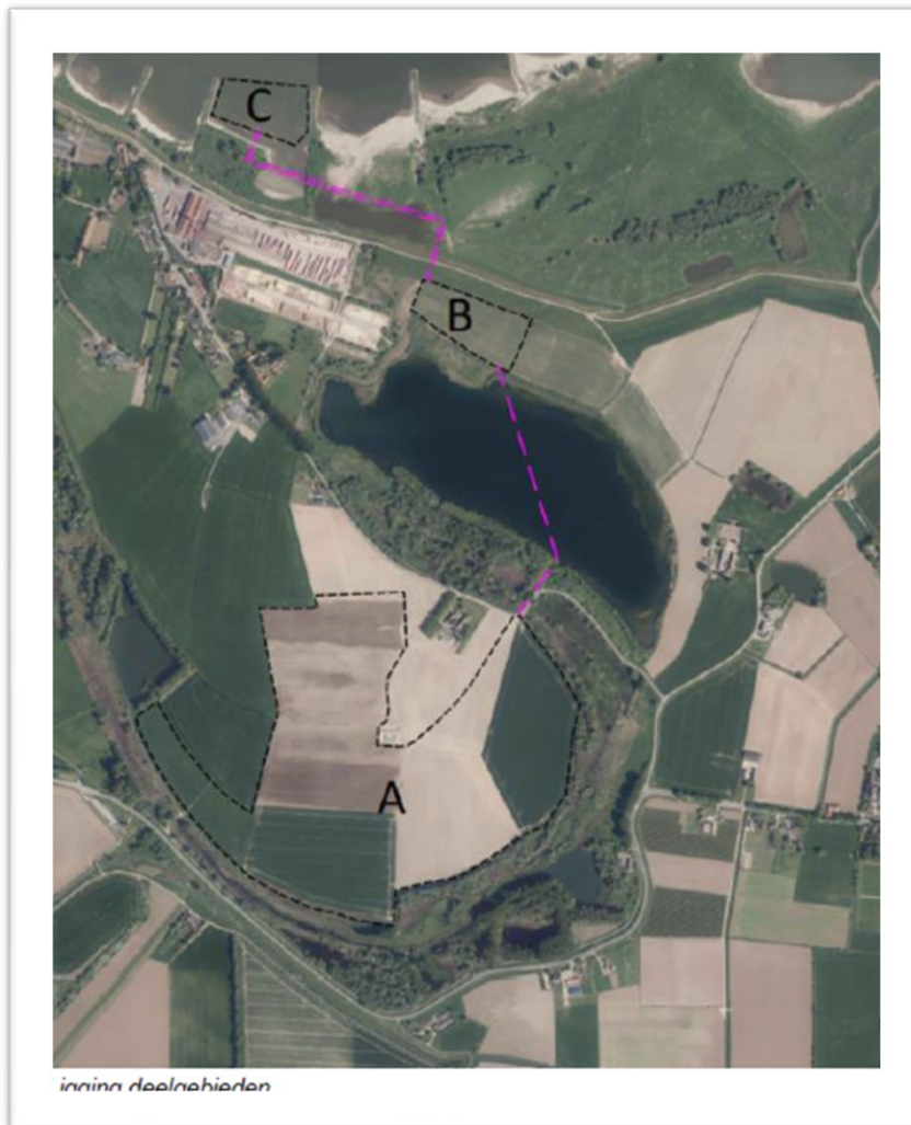
Fig. 1. Deelgebieden