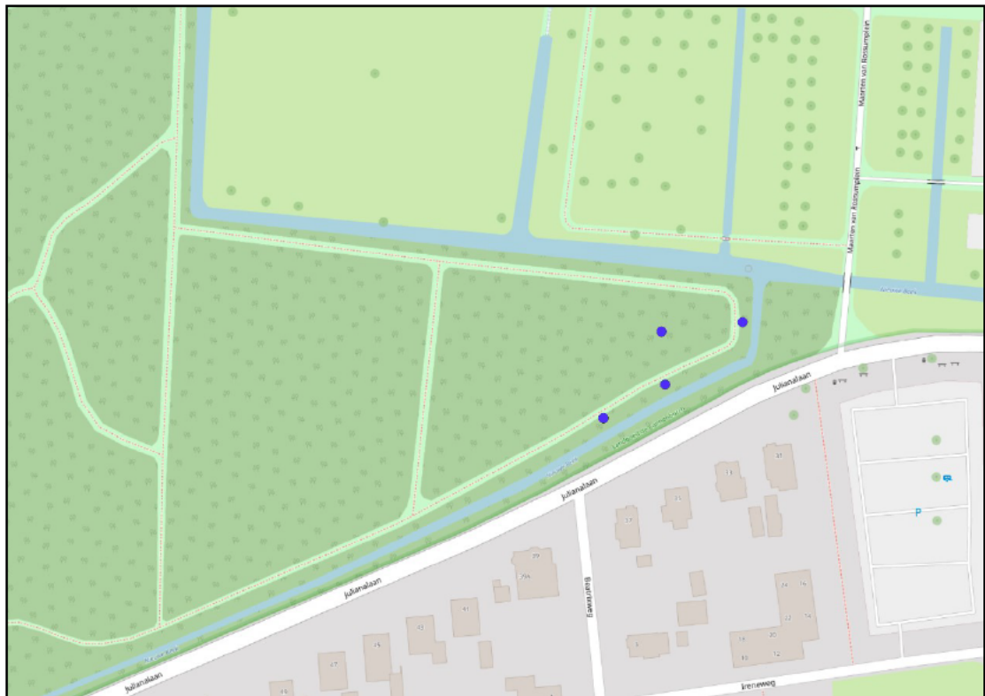
Figuur 2. De locaties van de vier permanente vleermuiskasten van het type Schwegler 2FN (weergegeven met blauwe stippen).