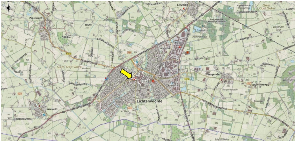
Figuur 1: Ligging plangebied binnen Lichtenvoorde, aangegeven met een gele pijl.