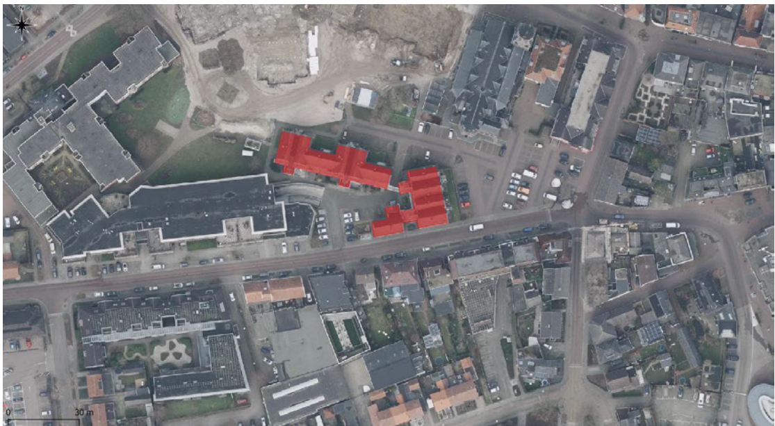
Figuur 2: Luchtfoto ligging plangebied. De te renoveren woningen zijn rood gemarkeerd.