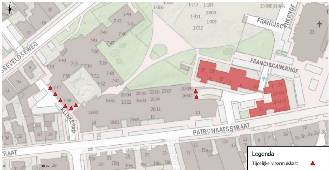
Figuur 3: Locaties tijdelijke mitigerende maatregelen, inclusief legenda.