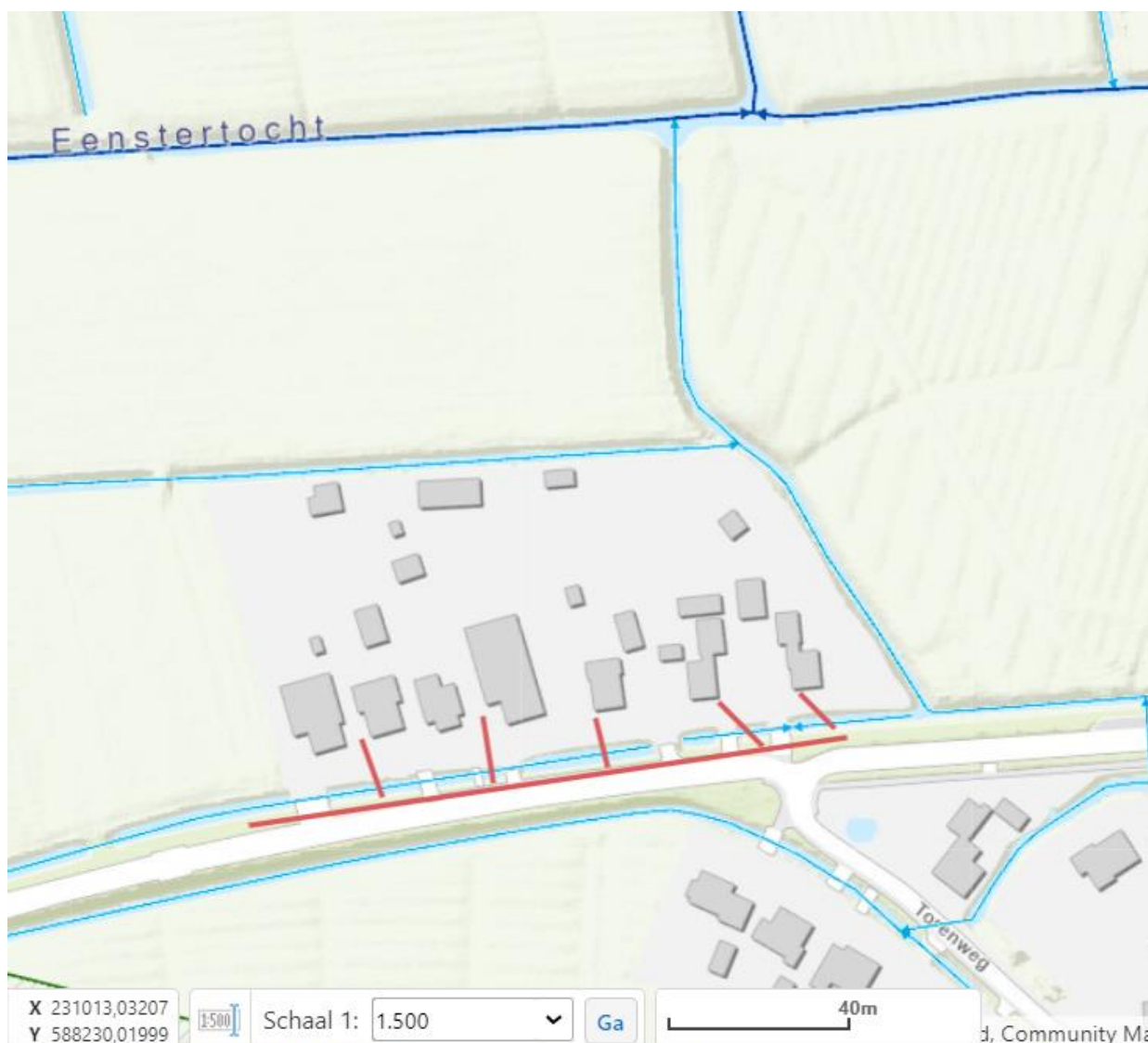
Figuur 1: Schematische tekening van de werkzaamheden. De rode lijn geeft globaal de locatie weer van de aan te leggen laagspanningskabels.

Het dagelijks bestuur van het waterschap Noorderzijlvest heeft op 17 juli 2023 van namens _____ een aanvraag ontvangen om een vergunning als bedoeld in hoofdstuk 6 van de Waterwet (Wtw). De aanvraag betreft het aanleggen van laagspanning- en middenspanningskabels nabij Torenweg 38 te Adorp, zoals hieronder globaal is weergegeven in figuur 1 en 2.