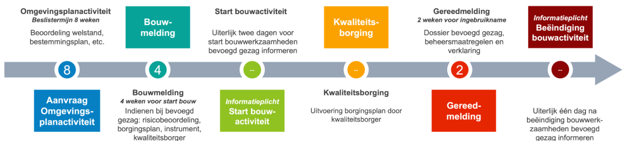
Figuur 3: Proces bouwtechnische activiteit en omgevingsplanactiviteit.

Als het bouwwerk technisch klaar is, dient de initiatiefnemer een Gereedmelding in (uiterlijk 2 weken voor ingebruikname). In deze melding zit naast de 'as built' tekeningen ook de verklaring van de kwaliteitsborger met de mededeling dat de kwaliteitsborger het gerechtvaardigd vertrouwen heeft dat het bouwwerk voldoet aan het Bbl. De gemeente controleert deze melding op volledigheid en toetst steekproefsgewijs de kwaliteit van de stukken. Zie het geschetste proces in figuur 3 hieronder: