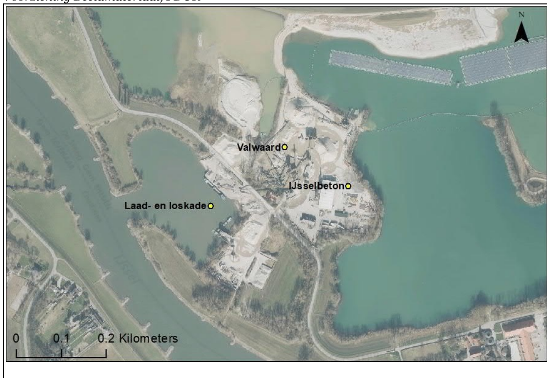
Figuur 1: Locatie activiteiten Havikerwaard 8A.