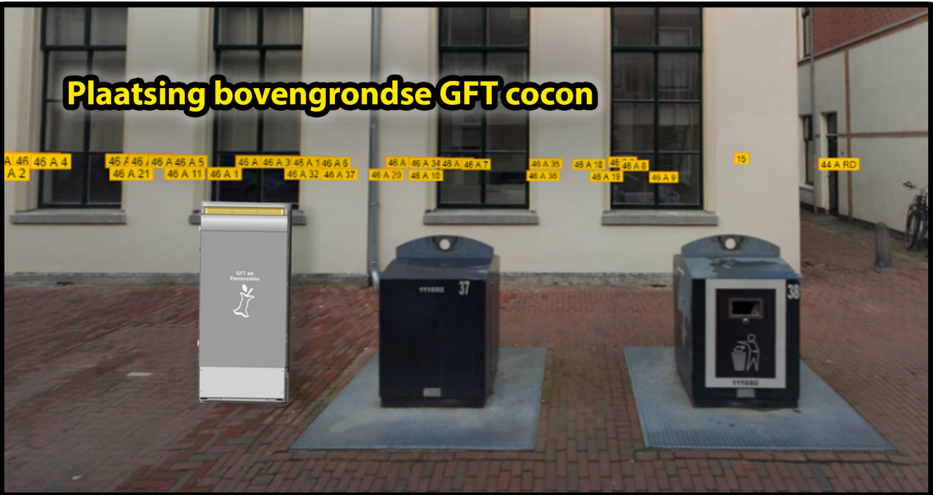
Plaatsing bovengrondse GFT cocon