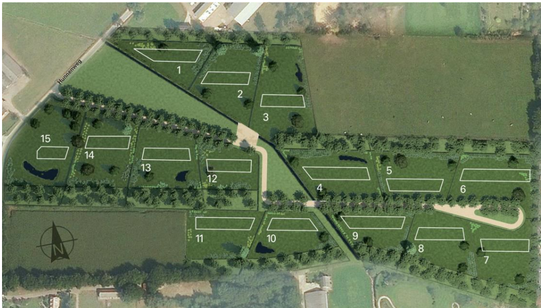
Figuur 3. Verkaveling landgoed Prinsenbosch.