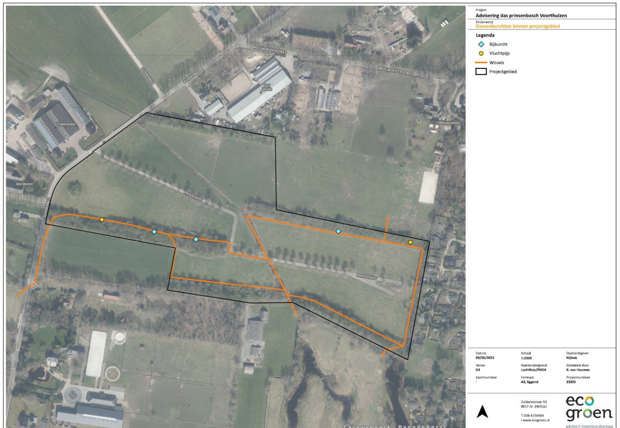
Figuur 1. Resultaten ecologisch onderzoek binnen plangebied.