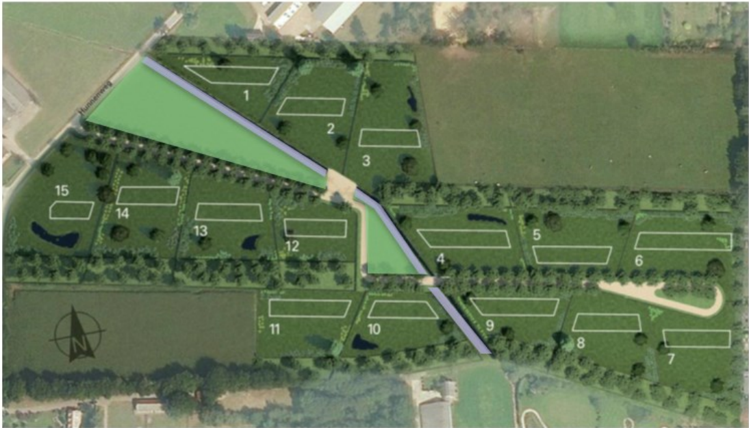
Figuur 1. Locaties kruidenrijk grasland (groene vlakken) en ruigtestrook (paarse vlakken).