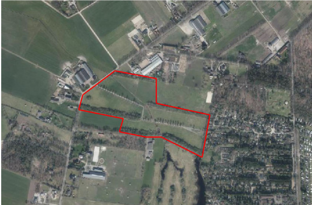
Figuur 2. Luchtfoto projectgebied.