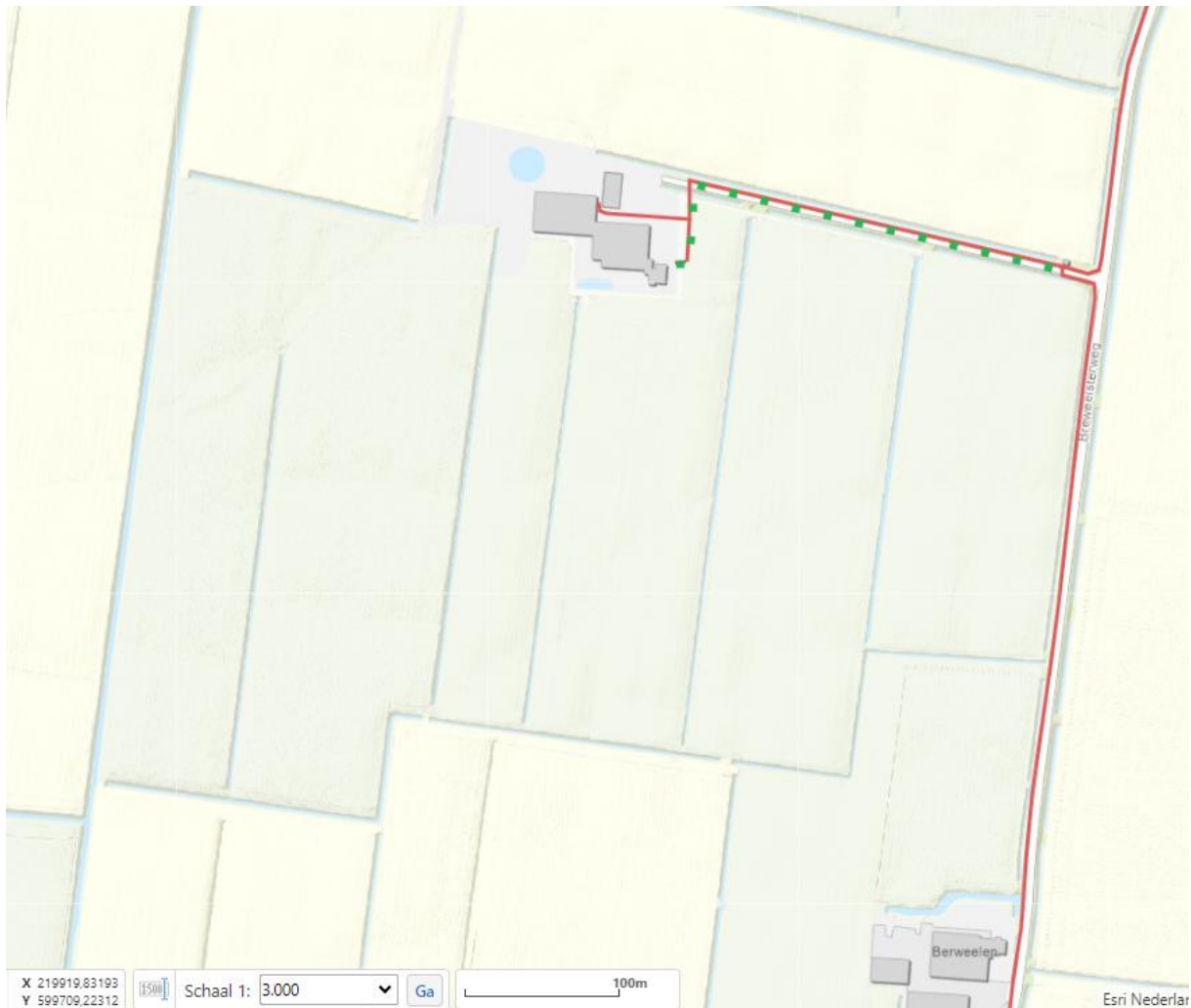
Figuur 2: Schematische tekening van de werkzaamheden. De rode lijn geeft globaal het aan te leggen tracé voor de middenspanningskabels weer en de groene stippellijn geeft globaal de locatie weer van de aan te leggen gasleiding.

De vergunningaanvraag is bij waterschap Noorderzijlvest geregistreerd onder het zaaknummer Z/23/063336 en omvat de volgende voor dit besluit relevante stukken: