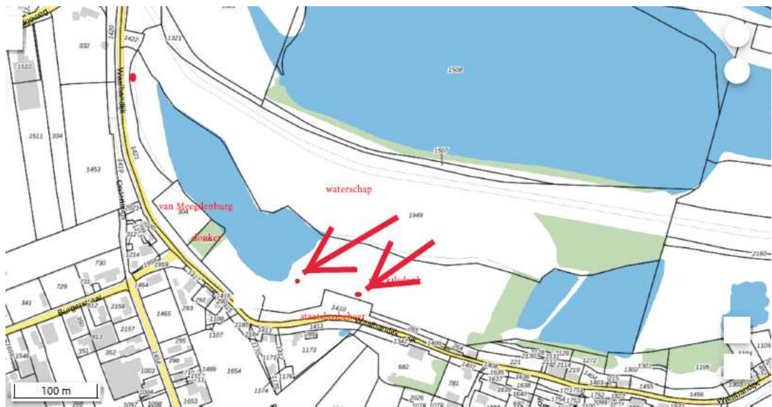
Figuur 7: Locaties van de twee te plaatsen marterkassen (rode stippen).