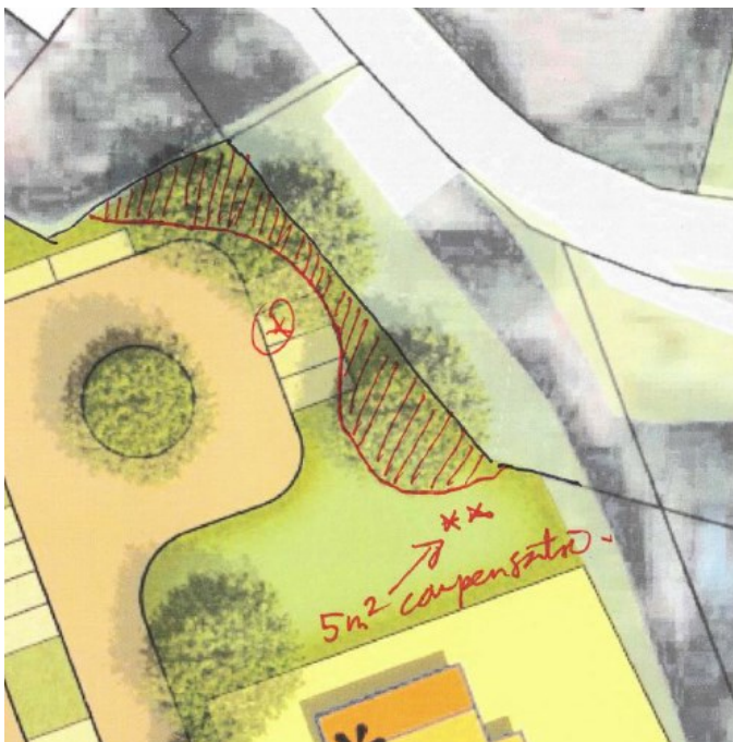
Figuur 7: Locatie van de aan te leggen meidoornhagen (locatie oranje lijn linkerkant figuur 6). De te behouden braamstruwelen zijn gearceerd. De te verwijderen braamstruwelen (5 m 2 ) zijn aangeduid met een *. De plaats waar het verlies aan braamstruweel wordt gecompenseerd d.m.v. het aanplanten van meidoornhagen is aangeduid met **.