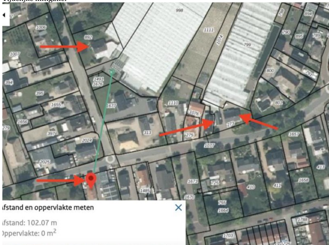
Figuur 3: De locaties van de vier tijdelijke verblijfplaatsen in de vorm van vleermuiskasten type Unitura VMT2 (rode pijlen).