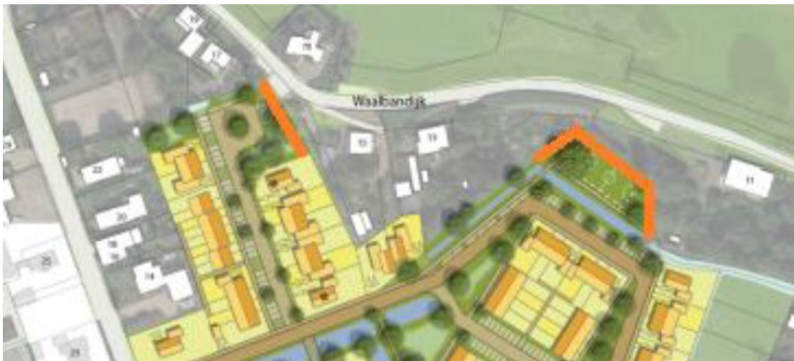
Figuur 6: Locatie van de aan te leggen meidoornhagen met een breedte van ca. 1 meter (oranje lijn aan de linkerkant)