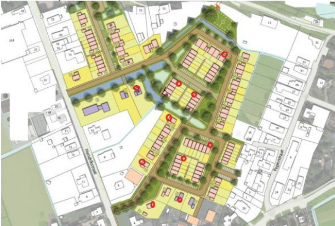
Figuur 4: De locaties van de 10 permanente verblijfplaatsen voor de gewone dwergvleermuis in de vorm van open stootvoegen van 2 cm die toegang geven tot de spouwmuren (rode cirkels).