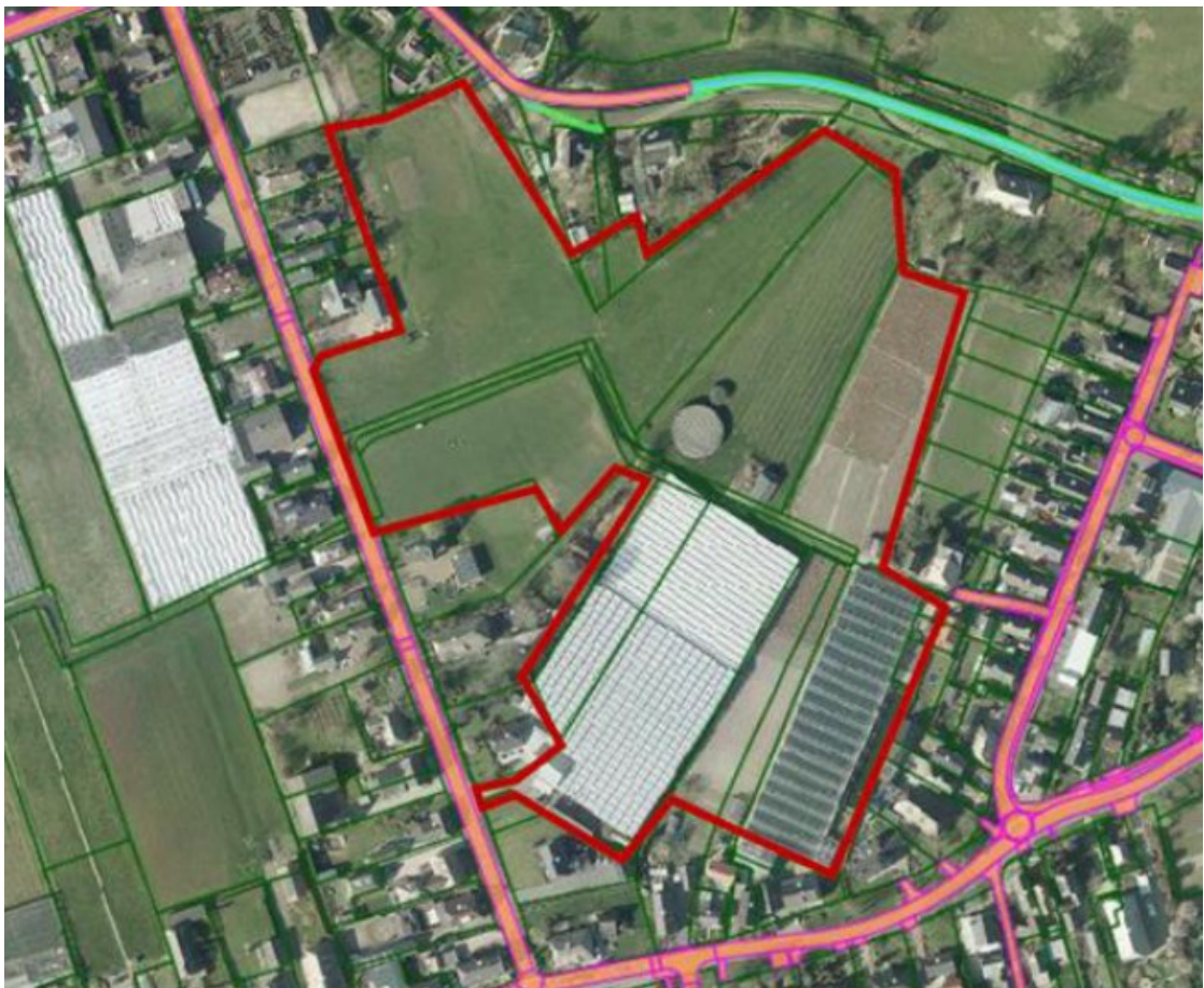
Figuur 1: Het projectgebied (rood omlijnd).

Alle zijdes van het projectgebied grenzen aan woningen met achtertuinen. In het projectgebied bevinden zich twee tuinbouwkassen, waarvan één is voorzien van een loods met kantoor. Daarnaast liggen er enkele akkers en weilanden met daartussen enkele watergangen binnen het plangebied en staan er twee waterbassins.