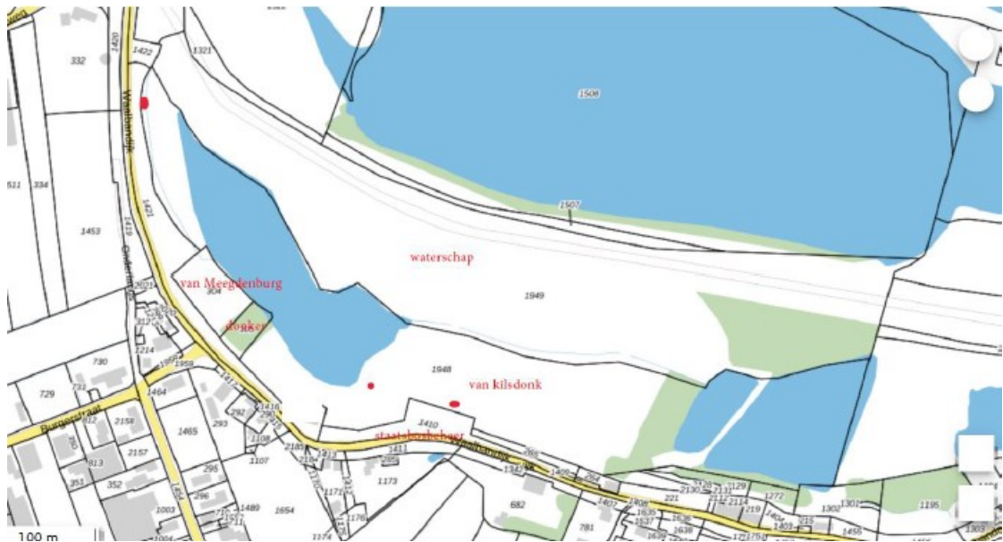
Figuur 5: Locaties van de drie geplaatste steenuilenkasten (rode stippen) en het perceel waar graasbeleid wordt toegepast (nummer 1948).