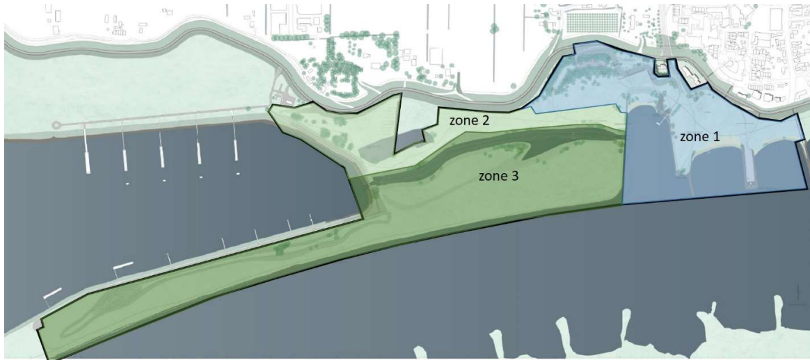
Figuur 3. Zoning plangebied

Zone 2 (ten noorden van de geul) is gericht op extensieve natuurbeleving . In deze zone komt een onverhard uitgemaaid struinp pad van oost naar west, met een aftakking naar de parkeerplaats. Deze zone is het gehele jaar toegankelijk. Er komt een vogelkijkscherm aan de noordzijde van de geul, tegenover het brede deel van de geul, met een informatiebord erbinnen over de geul en de natuurwaarden. Dit levert een markant punt op met uitzicht richting de Waal over de uiterwaard en de geul met het ondiepe paaigebied en de steilrandjes langs de oever. In zone 2 ligt ook de bestaande plas, die enigszins wordt heringericht voor verhoging van de natuurwaarden. Dit deel van de uiterwaard zal ingericht worden als kruidenrijk grasland. De vegetatie wordt in beide zones kort gehouden door grote grazers.