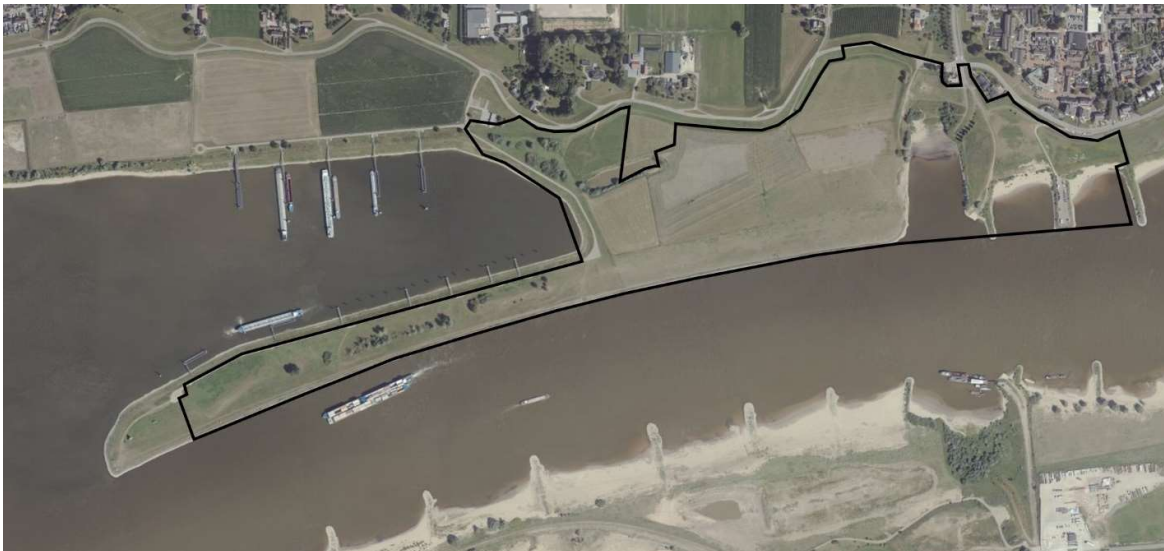
Figuur 2. Begrenzing plangebied