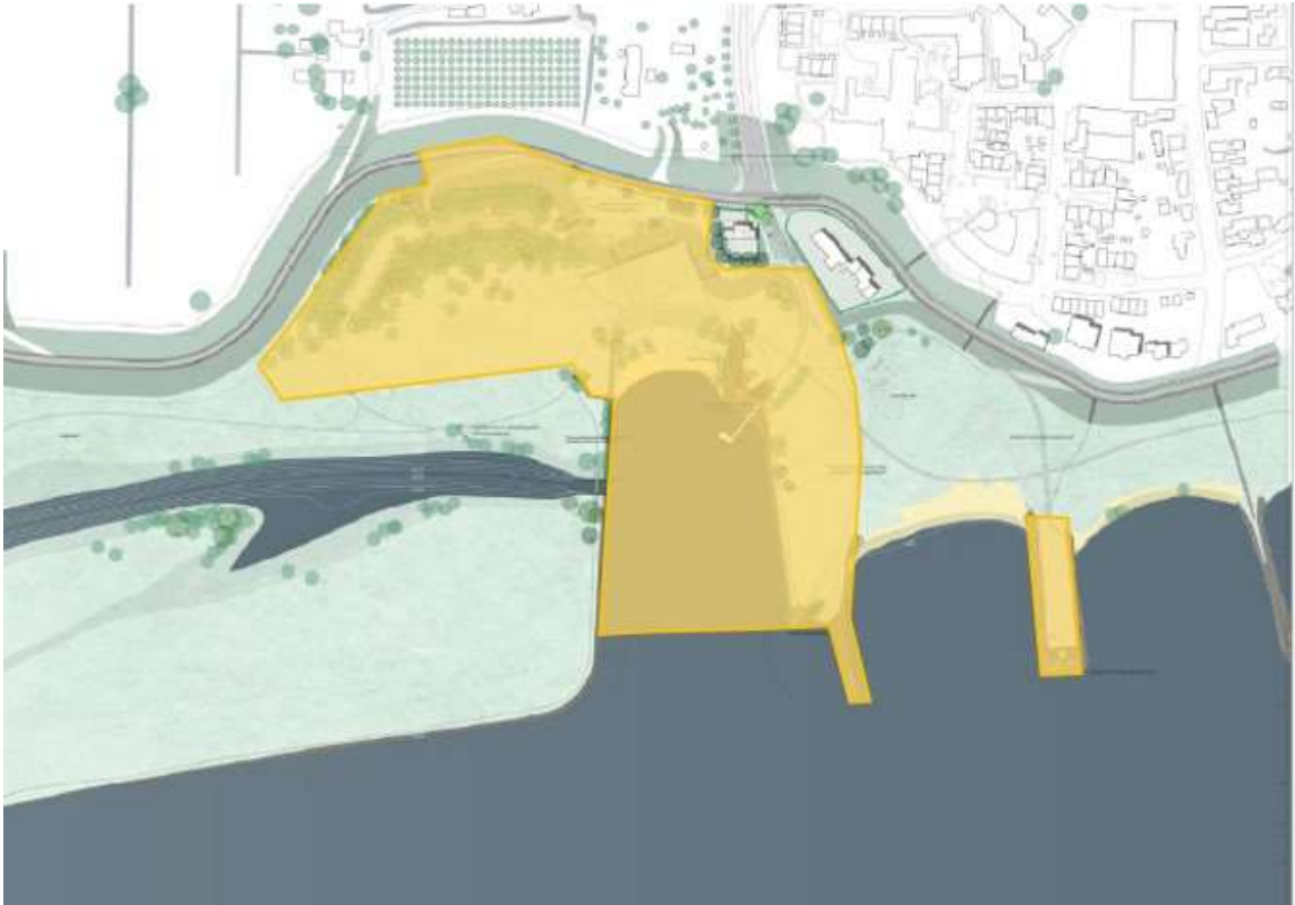
Figuur 1. Zoekgebied voor activiteiten in kader van fase 2