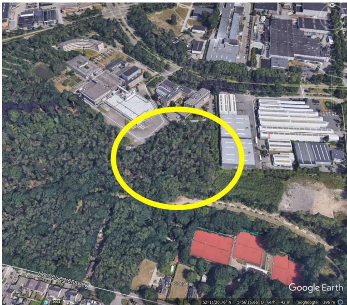
Figuur 1 . Ligging plangebied aan de Laan van Westenenk 8 te Apeldoorn.