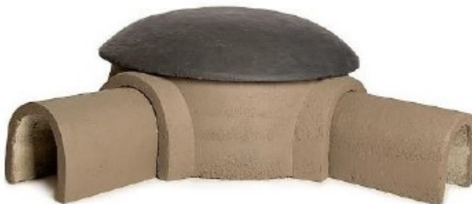
Figuur 3. Type steenmarterkast, model ZK EM 01 Egel- en Marterkast van Vivara Pro, die op 16 augustus 2022 zijn geplaatst op de locaties zoals aangegeven in figuur 2. De kasten zijn ingegraven en afgedekt met strooisel en takken.