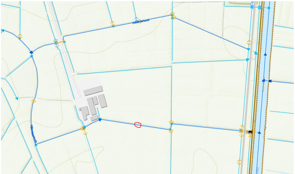
Figuur 1, locatie dam met duiker in hoofdwatengang Nijlandstertocht, nabij Albert Harkemaweg 82 te Aduard.