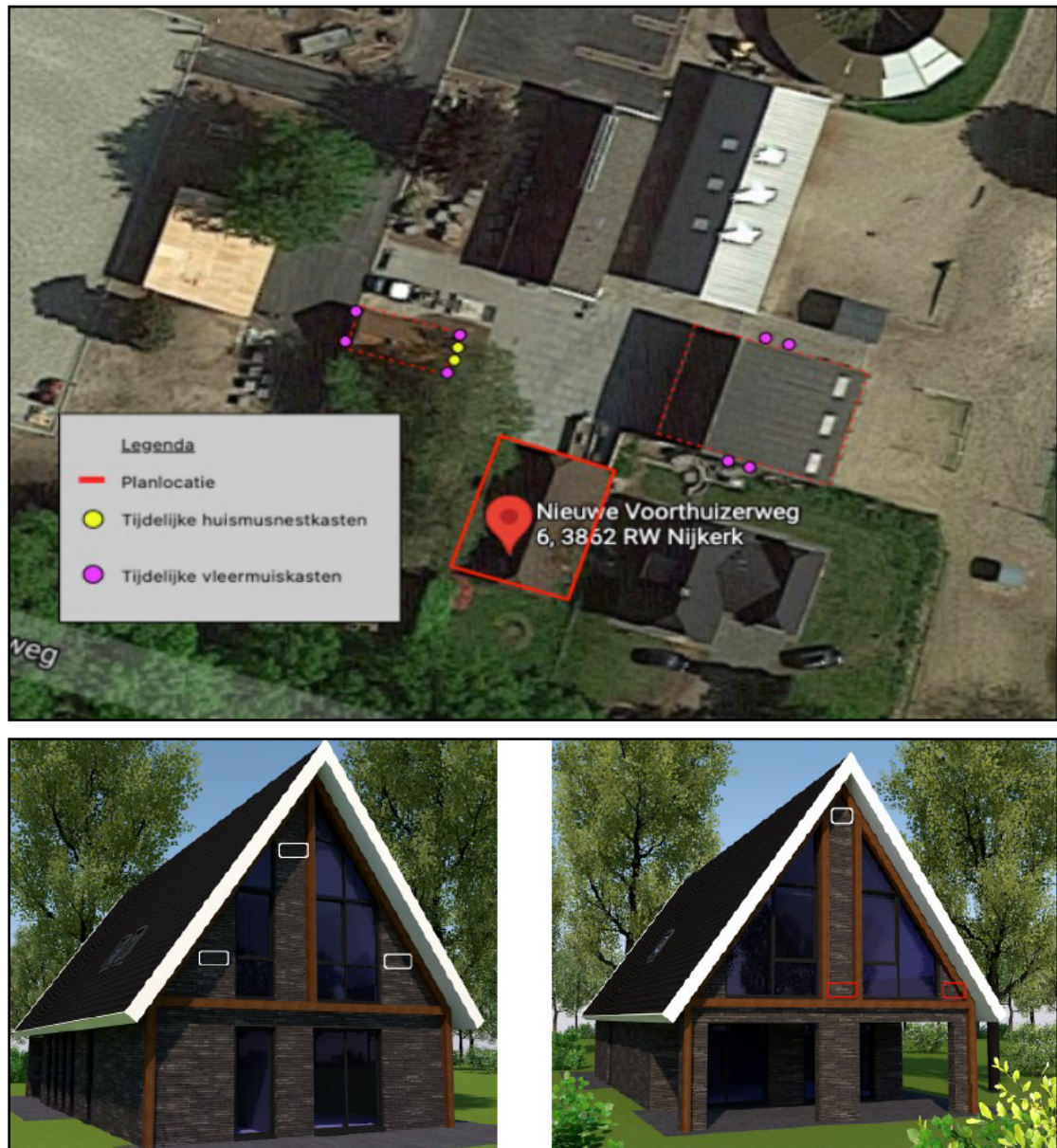
Figuur 2. De locaties van de tijdelijke (boven) en permanente (onder) voorzieningen voor huismus en gewone dwergvleermuis. De gele stippen op de bovenste afbeelding weergeven de locaties van 2 tijdelijke kasten van het type HMT2 van Unitura. De roze stippen weergeven de locaties van 8 tijdelijke kasten van het type VMT1a van Unitura. De te slopen woning is rood omlijnd weergegeven. Op de onderste afbeelding zijn de locaties van de permanente voorzieningen weergegeven. In wit: 4 locaties met dubbelgeschakelde vleermuisinbouwkasten en in rood 2 huismusinbouwkasten.