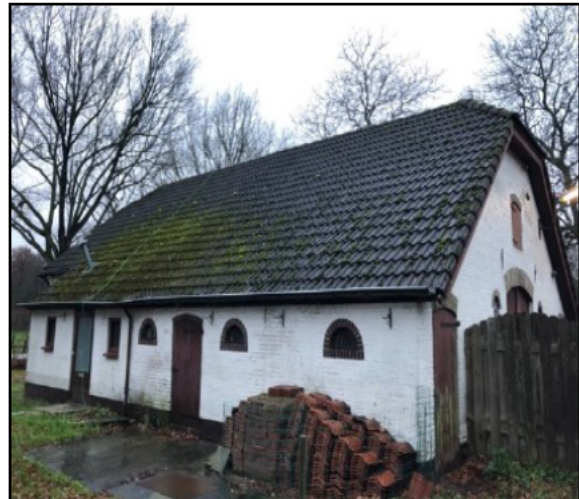
Figuur 1. De ligging en begrenzing van het plangebied aan de Nieuwe Voorthuizerweg 6 te Nijkerk. Op de afbeelding linksonder is de te slopen woning rood omlijnd. Rechtsonder is de te slopen woning weergegeven.