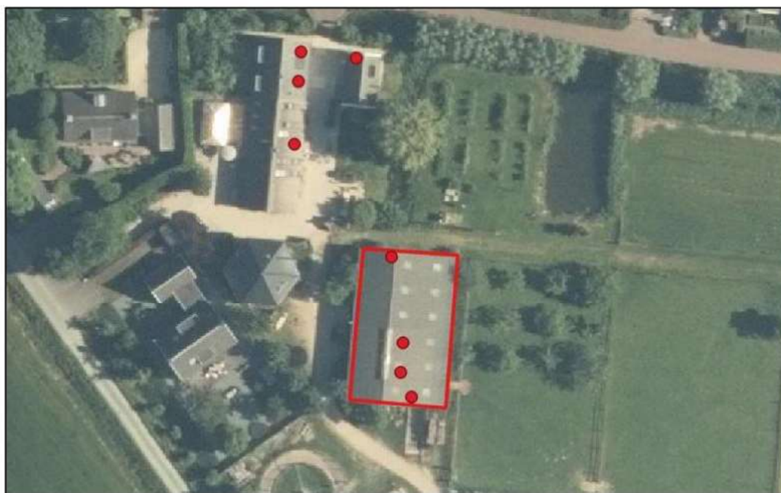
Figuur 4.2 Locaties van alle aangetroffen huismusnestplaatsen op in de te slopen paardenstal (rode contouren) en de omgeving daarvan. Bron achtergrond: PDOK.

Bron: "Activiteitenplan sloop en nieuwbouw paardenstal Mijndensedijk 53, Nieuwersluis" van 23 februari 2023.