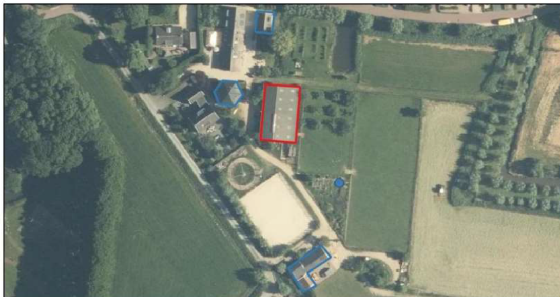
Figuur 6.1 Locaties van de tijdelijke huismuskasten (blauwe contouren) en de huismustil (blauwe punt) in de directe omgeving van het projectgebied (rode contouren).