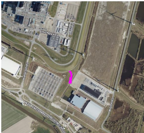
Figuur 1: Overzichtstekening (roze = locatie)

Het dagelijks bestuur van het waterschap Noorderzijlvest heeft op 23 mei 2023 van een aanvraag ontvangen om een vergunning als bedoeld in hoofdstuk 6 van de Waterwet (Wtw). De aanvraag betreft het aanbrengen van een pad van graskeien nabij de Synergieweg in de Eemshaven, zoals hieronder globaal is weergegeven in figuur 1.