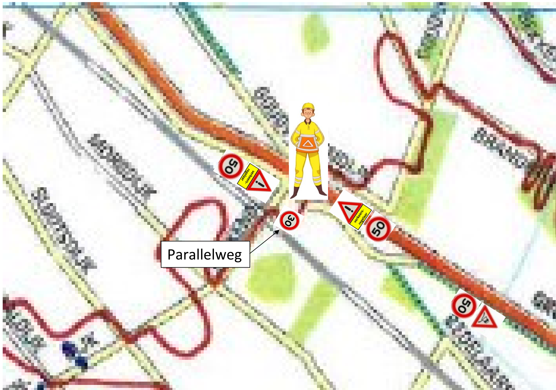
Losse bord 50km ter hoogte van 25.000mtr paal (zendmast).