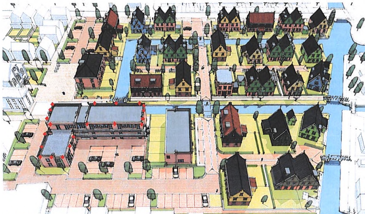
Figuur 1: Locaties permanente alternatieve verblijfplaatsen.