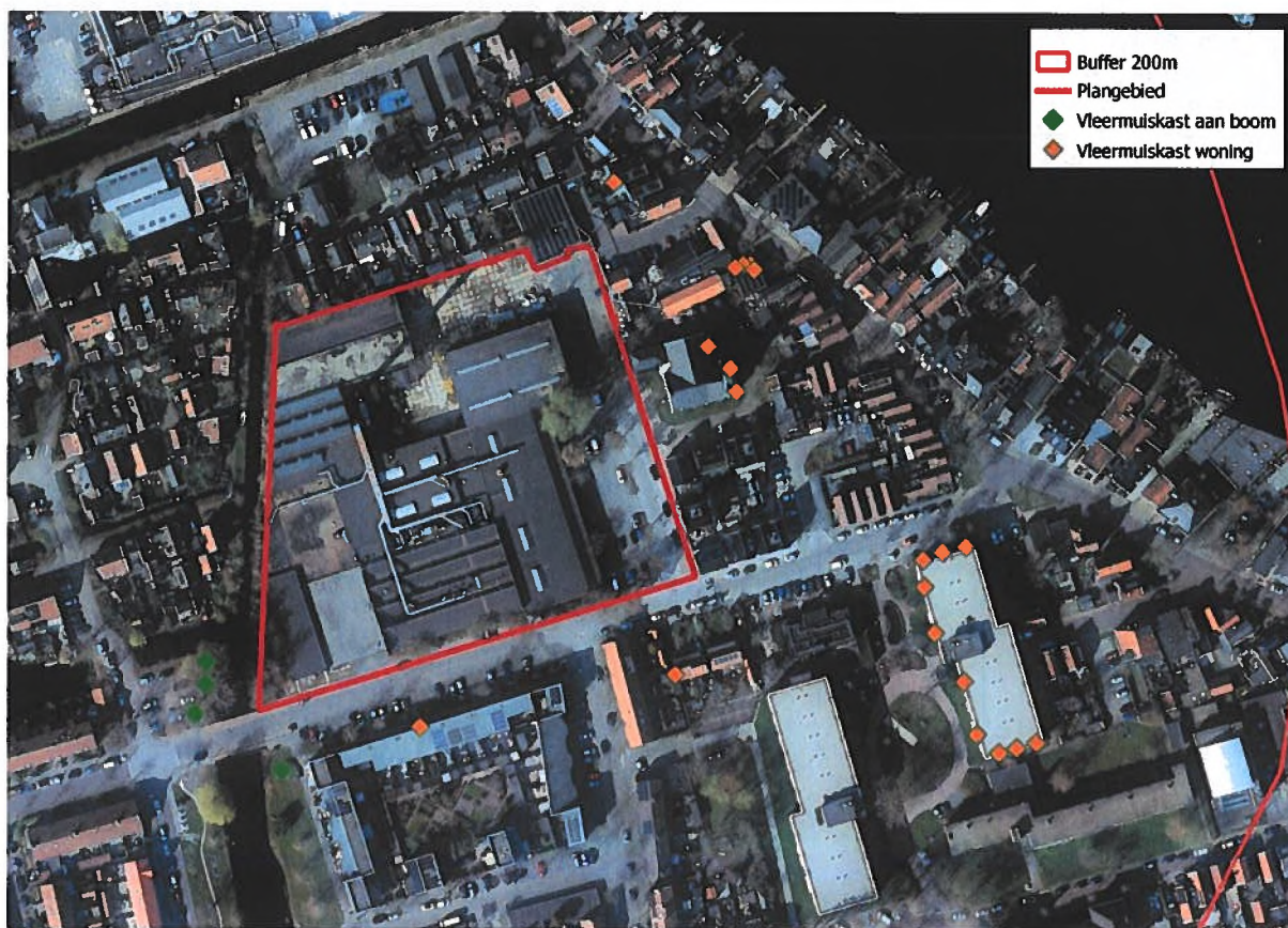
Figuur 1: Locaties tijdelijke alternatieve verblijfplaatsen.