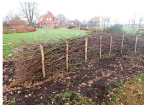
Figuur 2. Locaties alternatieve verblijfplaatsen steenmarter (gele sterren) en takkenrillen (zwarte stippellijnen) (boven); en marterkast ZK EM 01 en voorbeeld van een takkenril (onder).