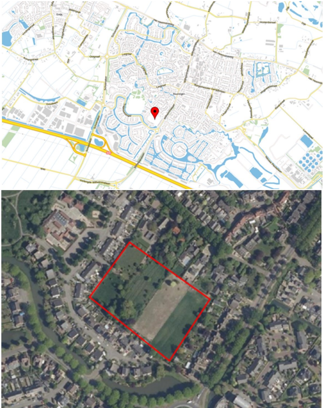
Figuur 1. Globale ligging plangebied Augustuslaan te Beuningen (boven) en begrenzing projectlocatie (onder).