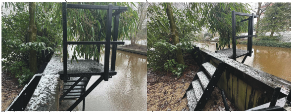
Reeds aanwezige trappen bij aangrenzende percelen.