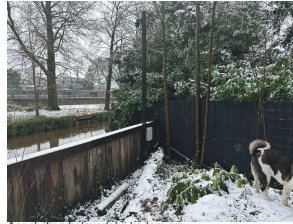
Aansluiting hekwerk bij kademuur. Plaats paal met camera