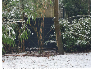
Aansluiting hekwerk einde perceel achterburen.