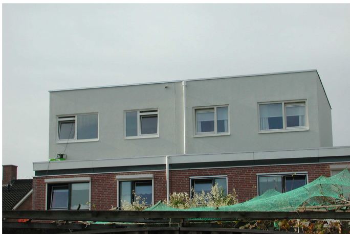
Vliegende Koffer 13-15 achterzijde