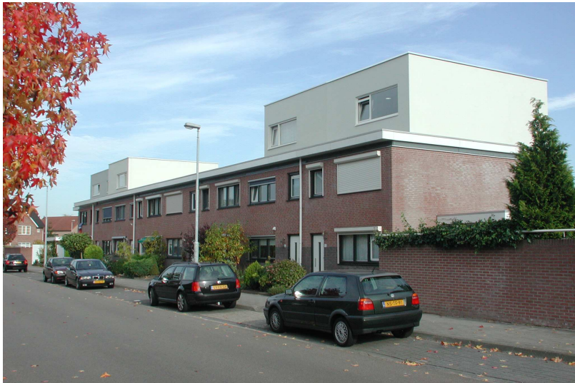
Vliegende Koffer 1-15