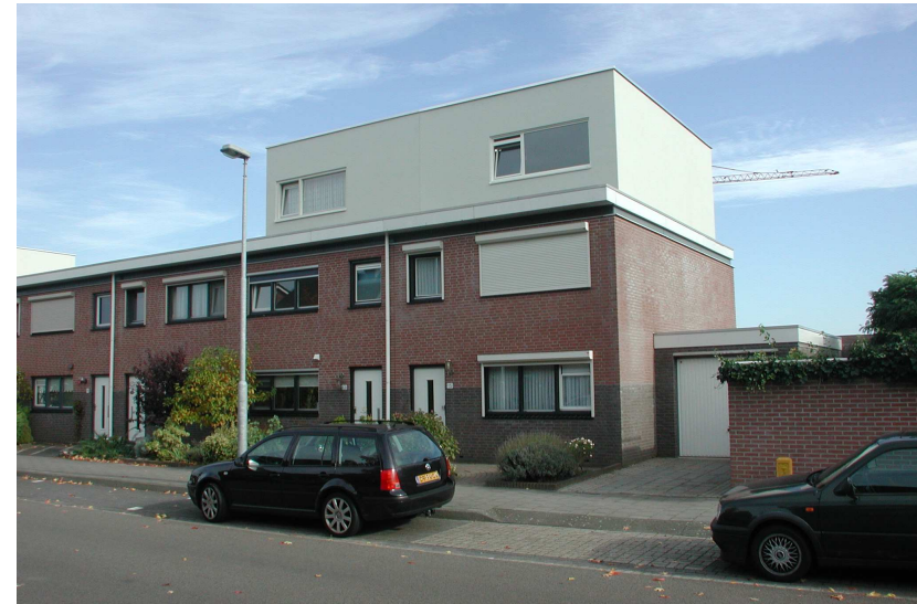
Vliegende Koffer 13-15