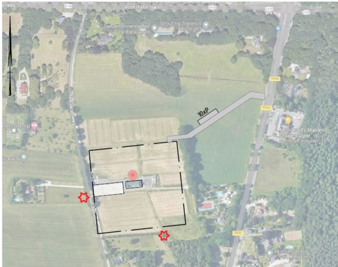
Figuur 1: Projectlocatie.