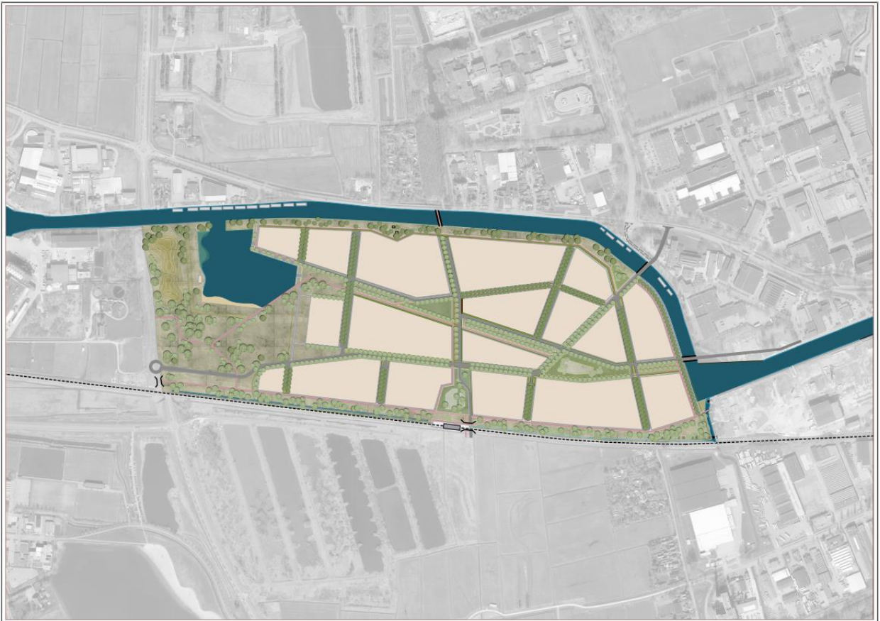
Bijlage 1: Tekening watercompensatie