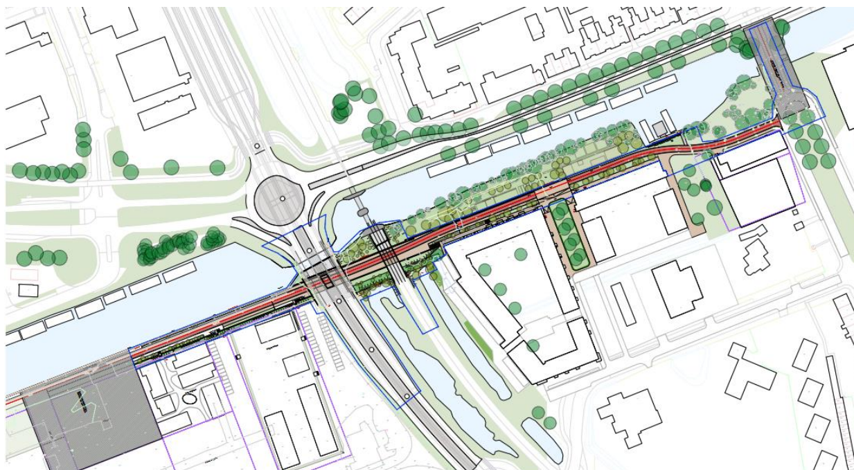
Figuur 1: Projectlocatie

De aanvraag betreft de realisatie van een onderdoorgang voor fietsers en voetgangers langs hoofdwatergang Hoendiep en onder de Laan 1940-1945 en de spoorlijn Groningen-Sauwerd door tot aan de Admiraal de Ruyterlaan, zoals hieronder is weergegeven in figuur 1.