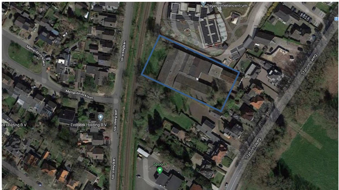
Figuur 1: Plangebied binnen blauwe kader (Bureau Natuurlijk, 2021)