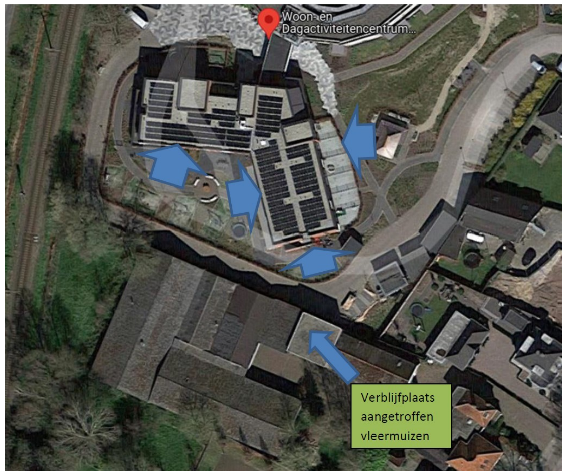
Figuur 2: Locaties van de tijdelijke vleermuiskasten (brede blauwe pijlen)