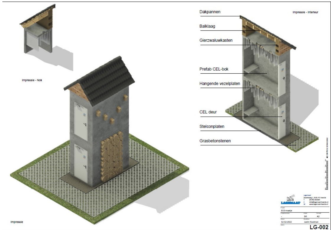
Figuur 3: Impressie van ECO-matje zoals deze binnen het plangebied wordt geplaatst.