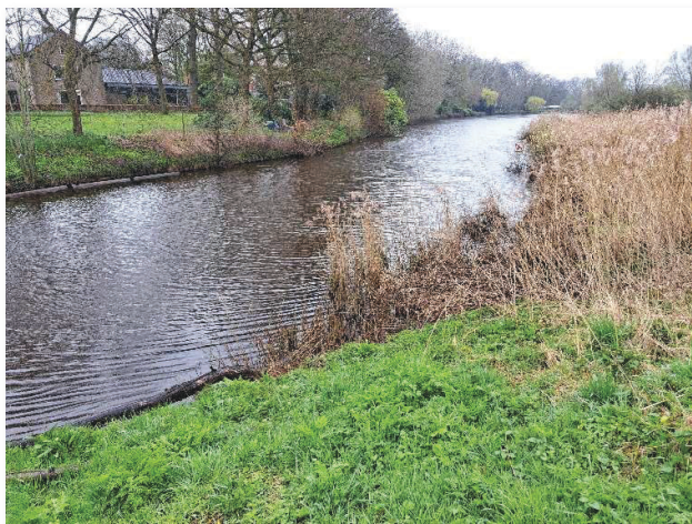
Foto 1 Bovenmark Breda, zuidelijk van de Duivelsbruglaan Het verbodsbord staat nu op ca. 30 m. stroomopwaarts van de Duivelsbrug.

In de laatste 5 jaar is er een forse toename van georganiseerde recreatie op de singels in Breda. Diverse bedrijven faciliteren kanovaarten en boottochten als groepsactiviteit. De toegenomen drukte op en langs het water heeft meermalen geleid tot klachten van aanwonenden. Tegelijk geldt er sinds 2017 een permanent vaarverbod voor gemotoriseerd verkeer op het deel van de Bovenmark ten zuiden van de Duivelsbruglaan te Breda. Diverse partijen hebben bij Waterschap Brabantse Delta jaarlijks een verzoek tot ontheffing ingediend. De druk om georganiseerd gebruik te mogen maken van de Bovenmark tussen Duivelsbrug en stuw Bieberg neemt toe. Zo heeft de aanvraag vorig jaar over het mogen varen tot de stuw Bieberg in het kader van rondvaarten geleid tot zienswijzen en bezwaren. Ook dit jaar ligt er een aanvraag van de firma 'Bootje Varen' voor het aanleggen bij de bestaande steiger/vlonder nabij de kerk. Men wil hier kunnen uitstappen om mensen een sanitaire stop te kunnen aanbieden bij horecagelegenheden op de Ginnekenmarkt.