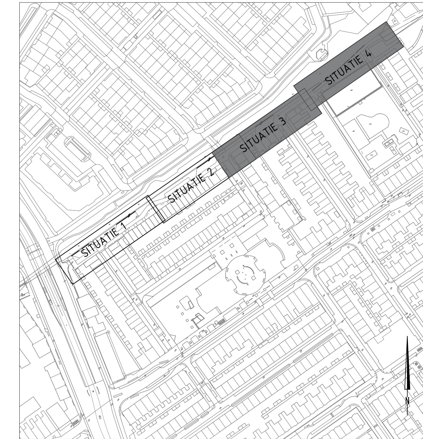
TOTAALOVERZICHT Schaal 1:1500