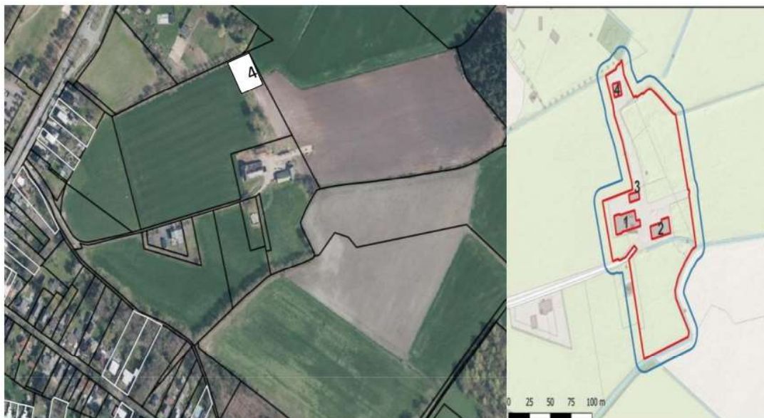
Fig.1 Binnen het plangebied is 1 vaste rust- en verblijfplaats (roestplaats) van kerkuil aanwezig in het noordelijke deel van de veldschuur (4) linksboven op de bovenste dwarsbalk.