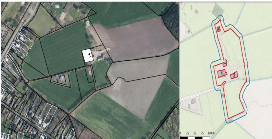
Fig.4: Nestlocatie zwarte roodstaart.