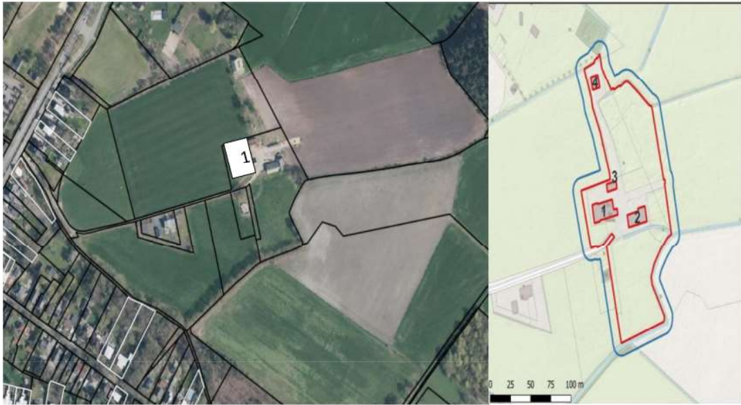
Fig.5: Nestlocatie spreekw in oude monumentale boerderij.