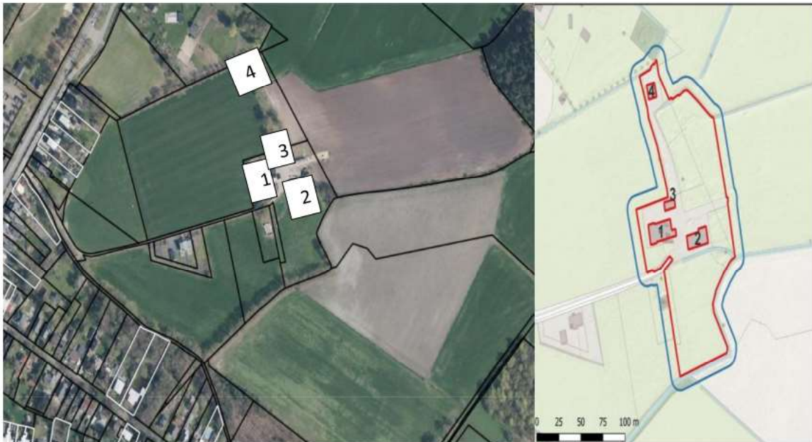
Fig. 3: nestlocaties boerenzwaluw