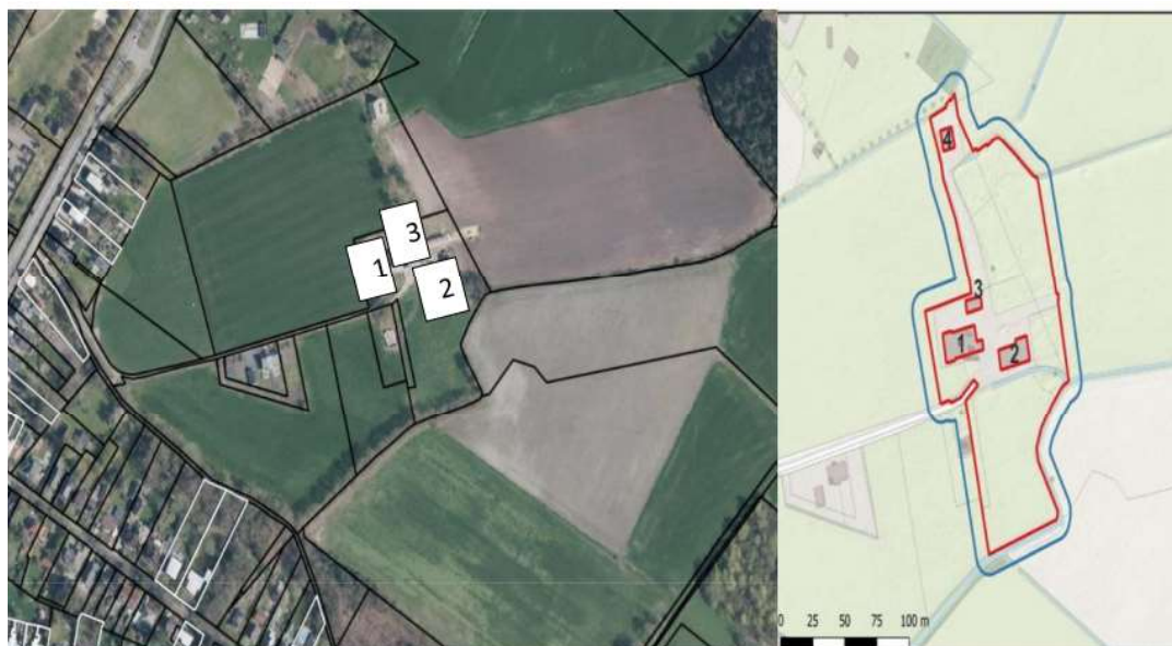
Fig.2 geeft de vaste rust en verblijfplaatsen weer van de steenmarter, de omgeving van het erf en agrarische percelen als essentieel leefgebied.