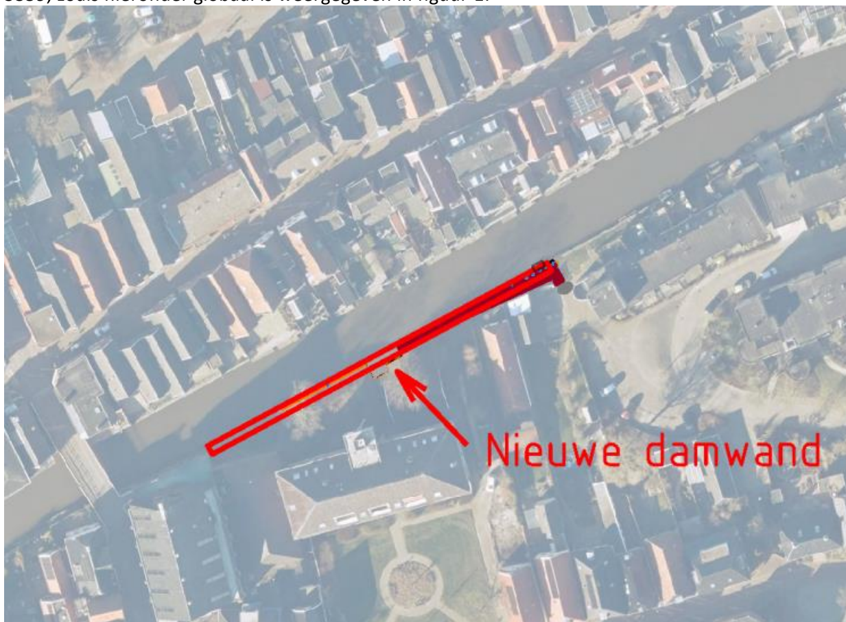
Figuur 1: Locatie te vervangen damwand.

Het dagelijks bestuur van het waterschap Noorderzijlvest heeft op 24 mei 2023 van een aanvraag ontvangen om een vergunning als bedoeld in hoofdstuk 6 van de Waterwet (Wtw). De aanvraag betreft het vervangen van een houten damwand door stalen damwanden met houten bekleding nabij de percelen kadastraal bekend als Appingedam, sectie D, perceelnummers 3167 en 3359, zoals hieronder globaal is weergegeven in figuur 1.